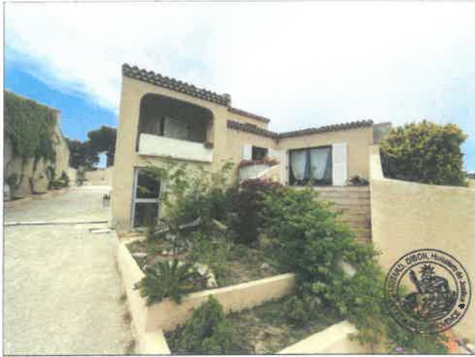
9. (02/06/2023 14:08:44)