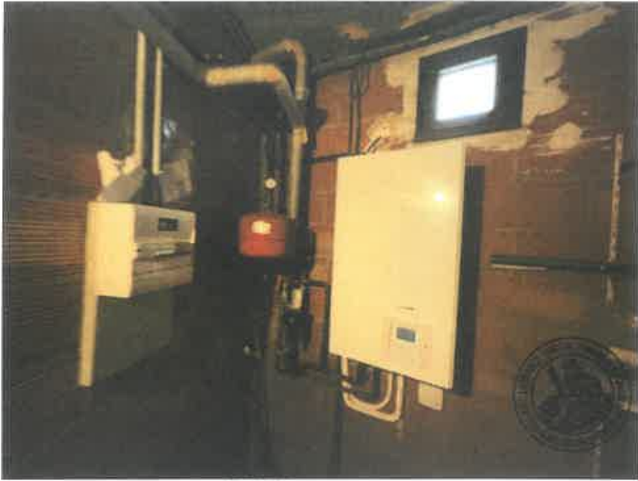
91. (02/06/2023 14:50:02)