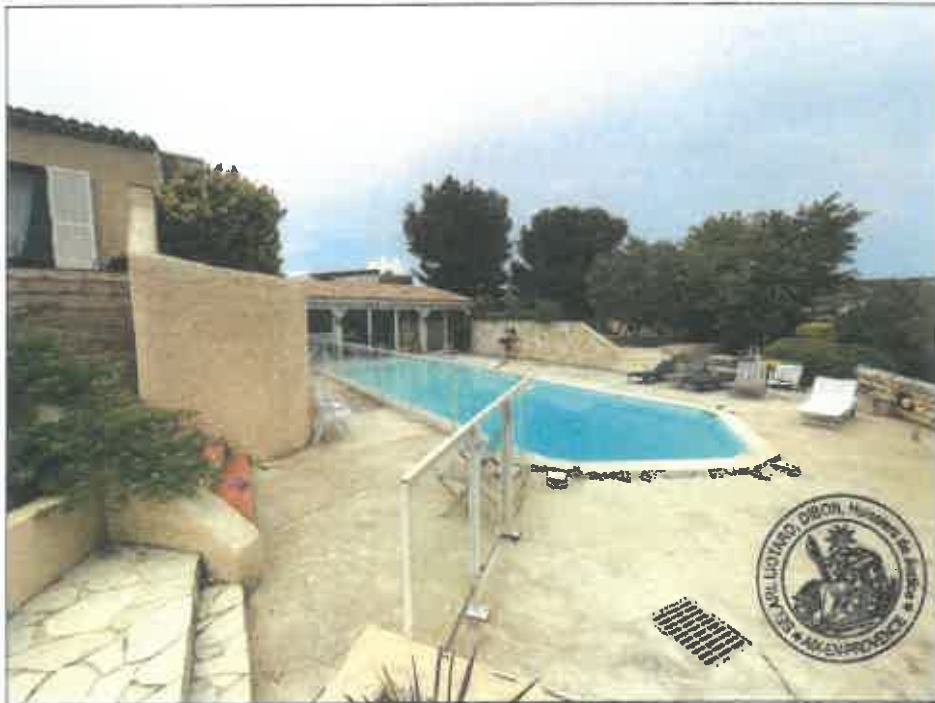
10. (02/06/2023 14:08:47)