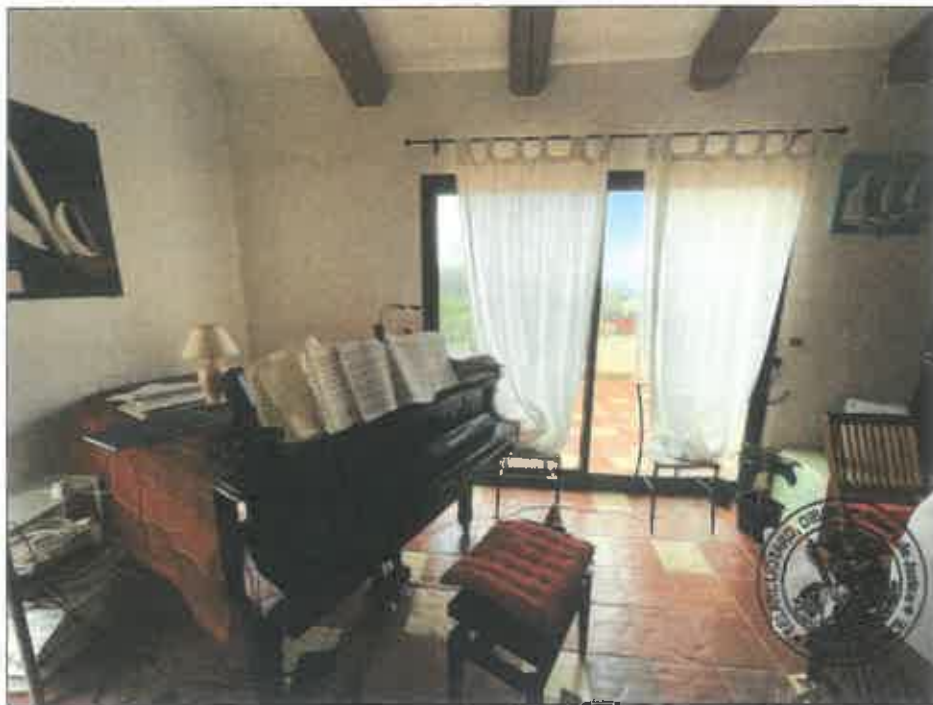
20. (02/06/2023 14:19:23)