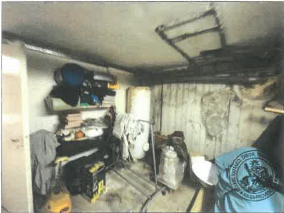
100. (02/06/2023 14:55:23)