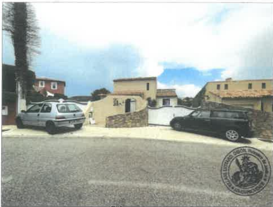
1. (02/06/2023 14:03:42)