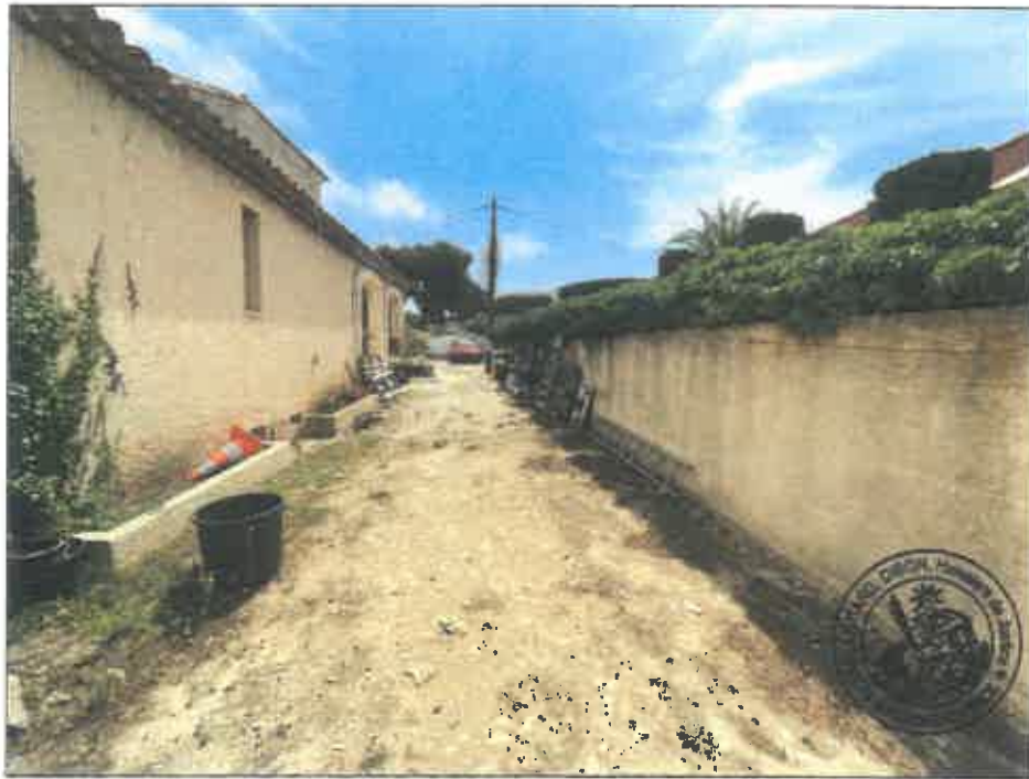
104. (02/06/2023 14:56:46)