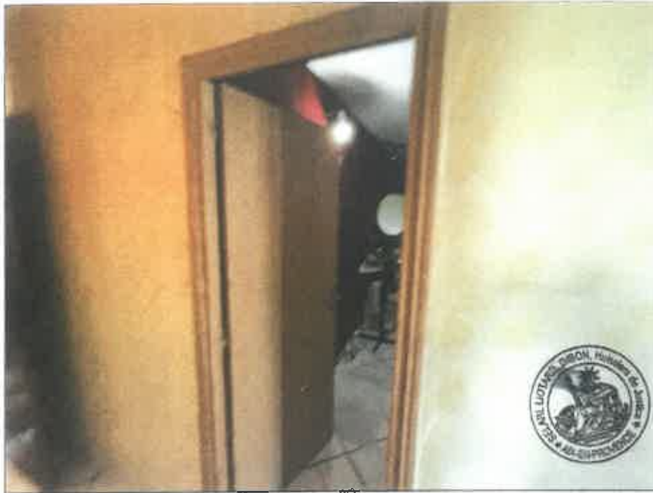
45. (02/06/2023 14:30:12)