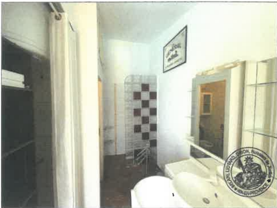
62. (02/06/2023 14:47:08)