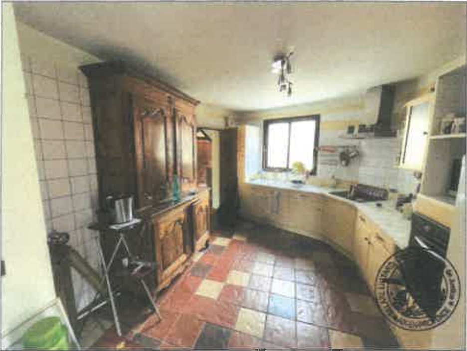
36. (02/06/2023 14:23:35)