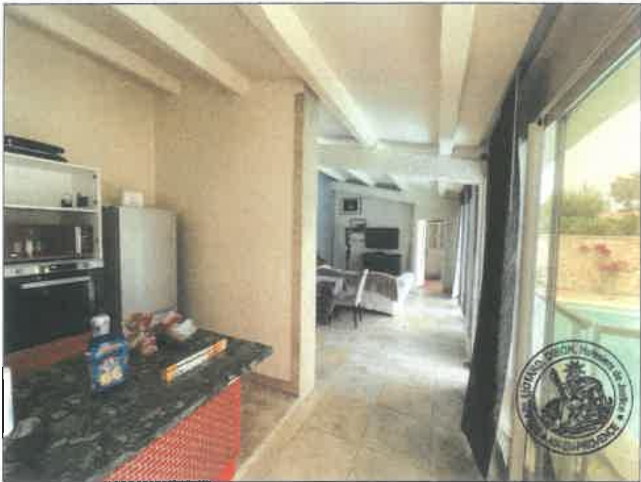
56. (02/06/2023 14:46:42)