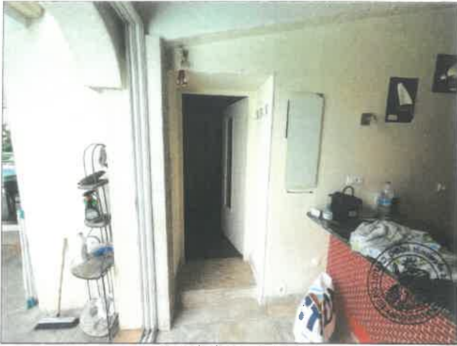
69. (02/06/2023 14:47:37)