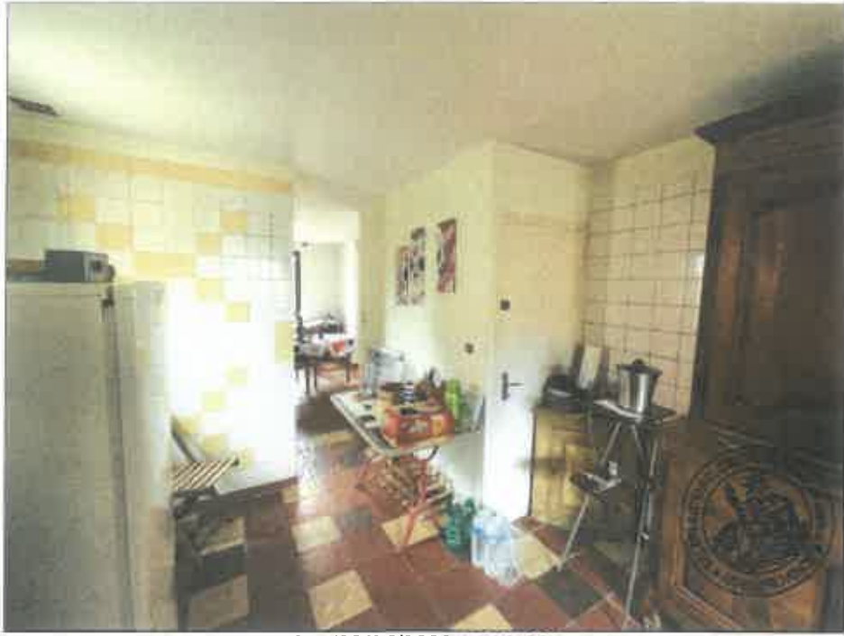
35. (02/06/2023 14:23:25)