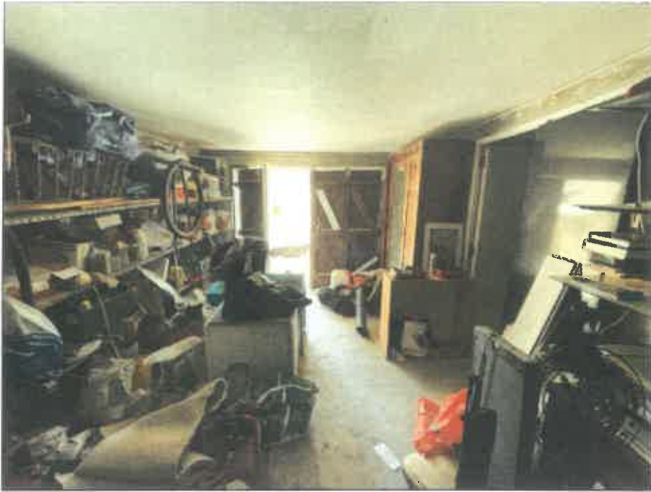
95. (02/06/2023 14:54:56)