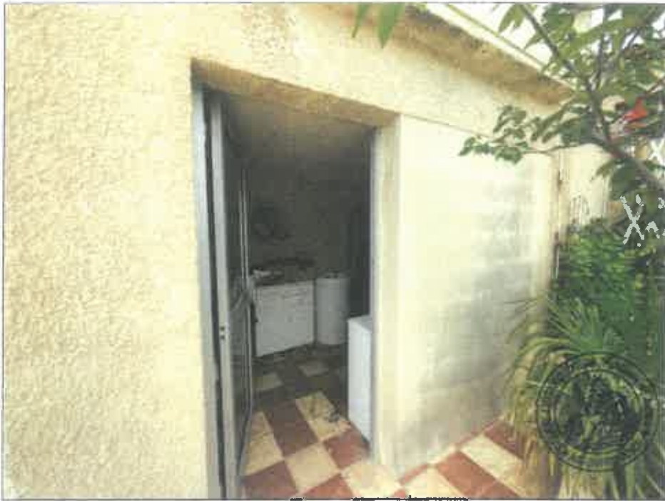
113. (02/06/2023 14:58:55)