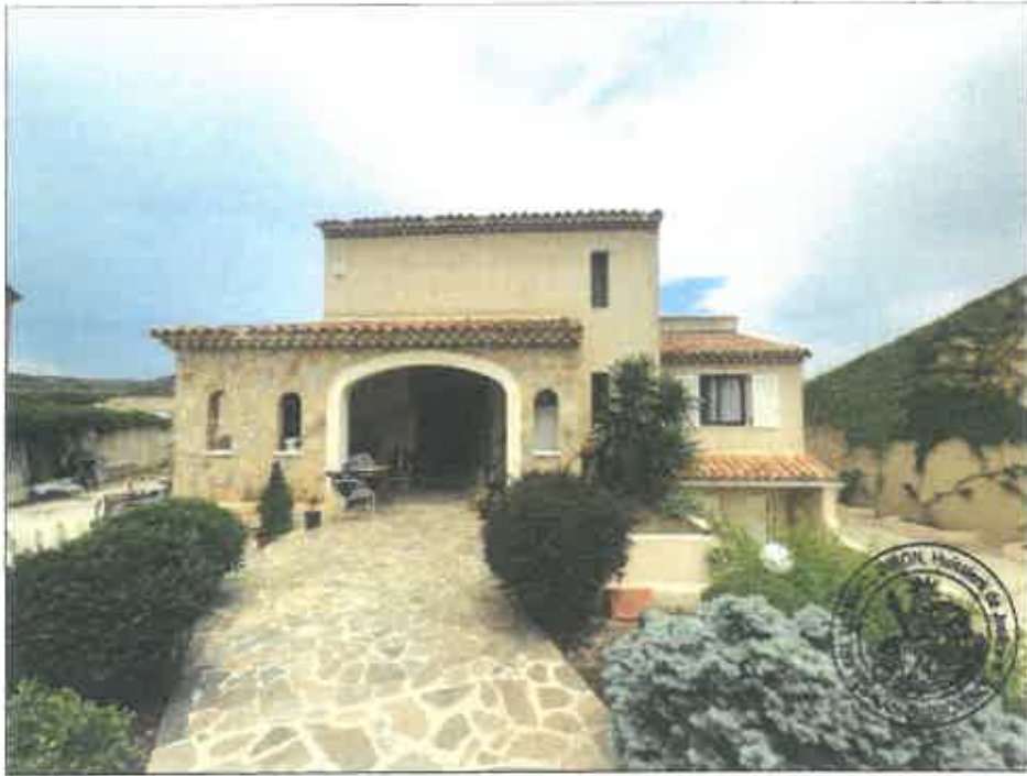
3. (02/06/2023 14:07:56)