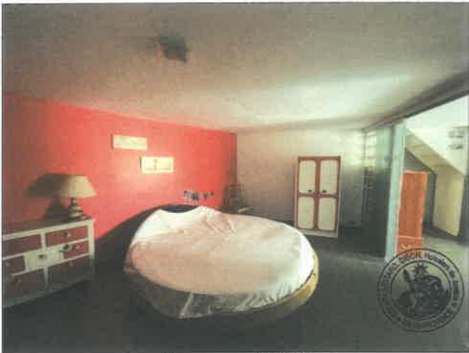
82. (02/06/2023 14:48:50)