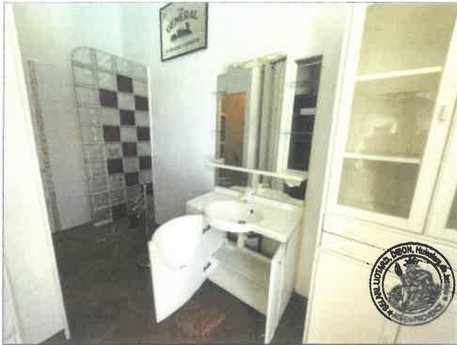
63. (02/06/2023 14:47:09)