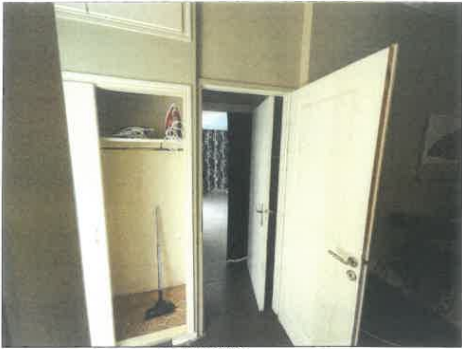
73. (02/06/2023 14:48:00)