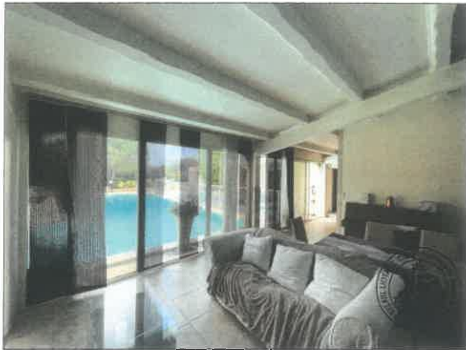
60. (02/06/2023 14:46:59)