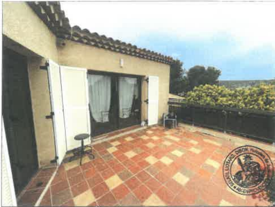
27. (02/06/2023 14:20:01)