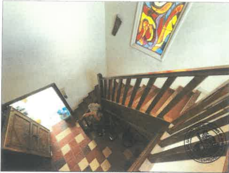
51. (02/06/2023 14:31:57)