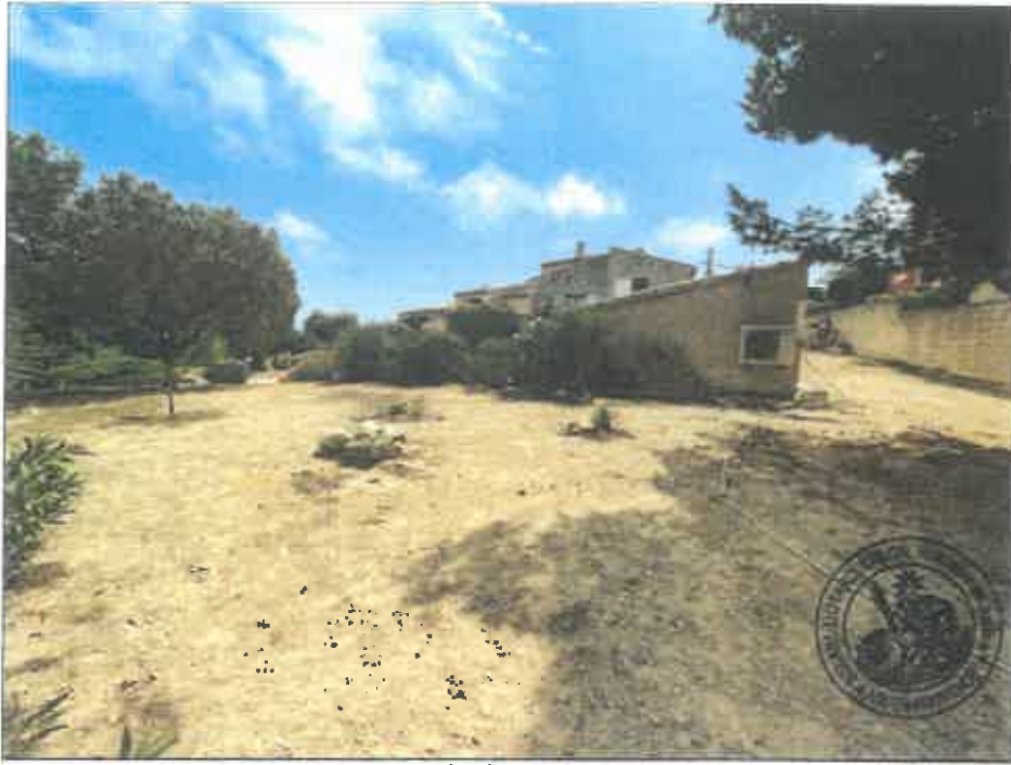
107. (02/06/2023 14:57:17)