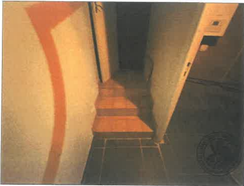
88. (02/06/2023 14:49:14)