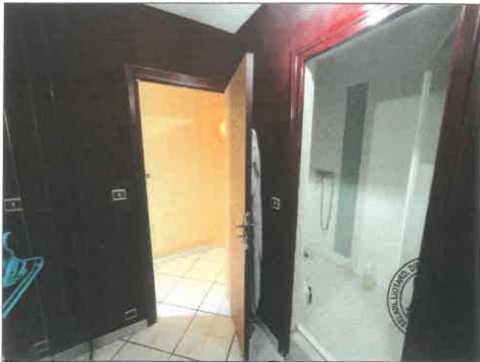
50. (02/06/2023 14:30:49)