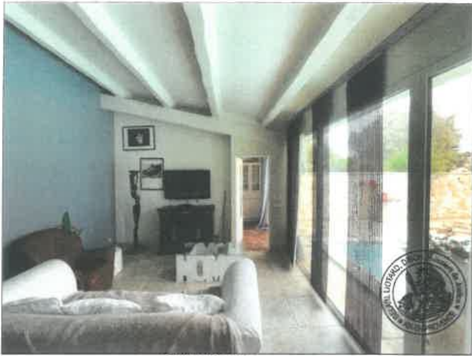
59. (02/06/2023 14:46:50)