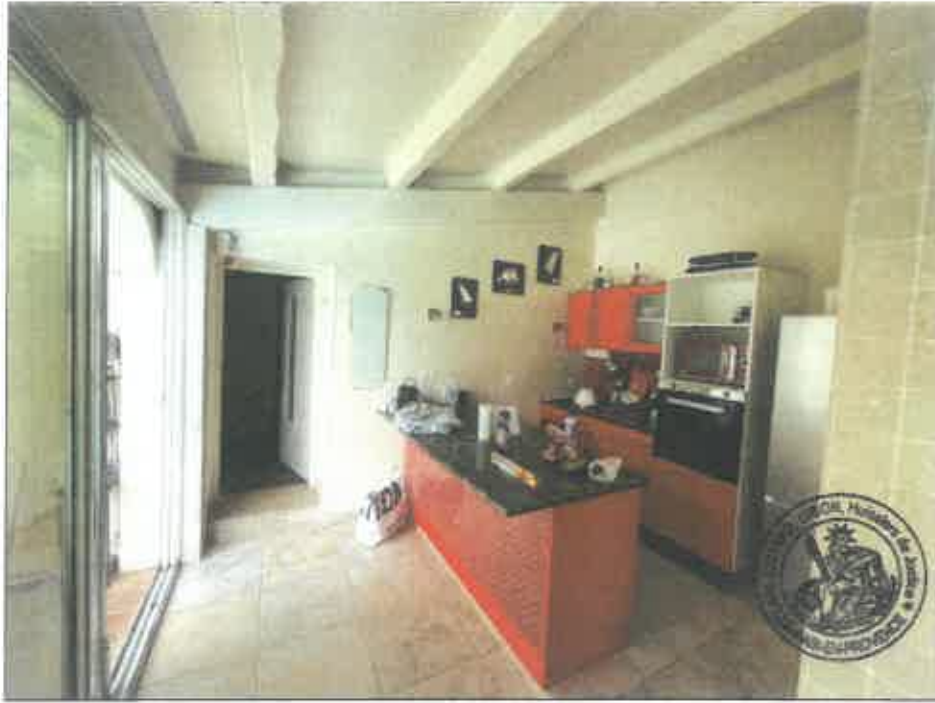
57. (02/06/2023 14:46:46)