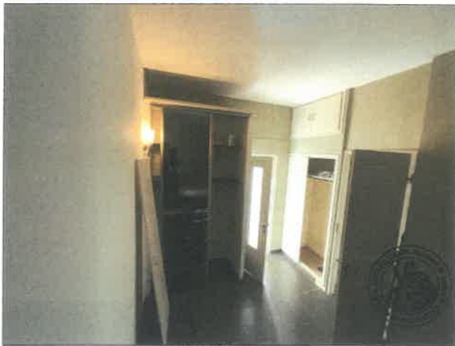
72. (02/06/2023 14:47:55)