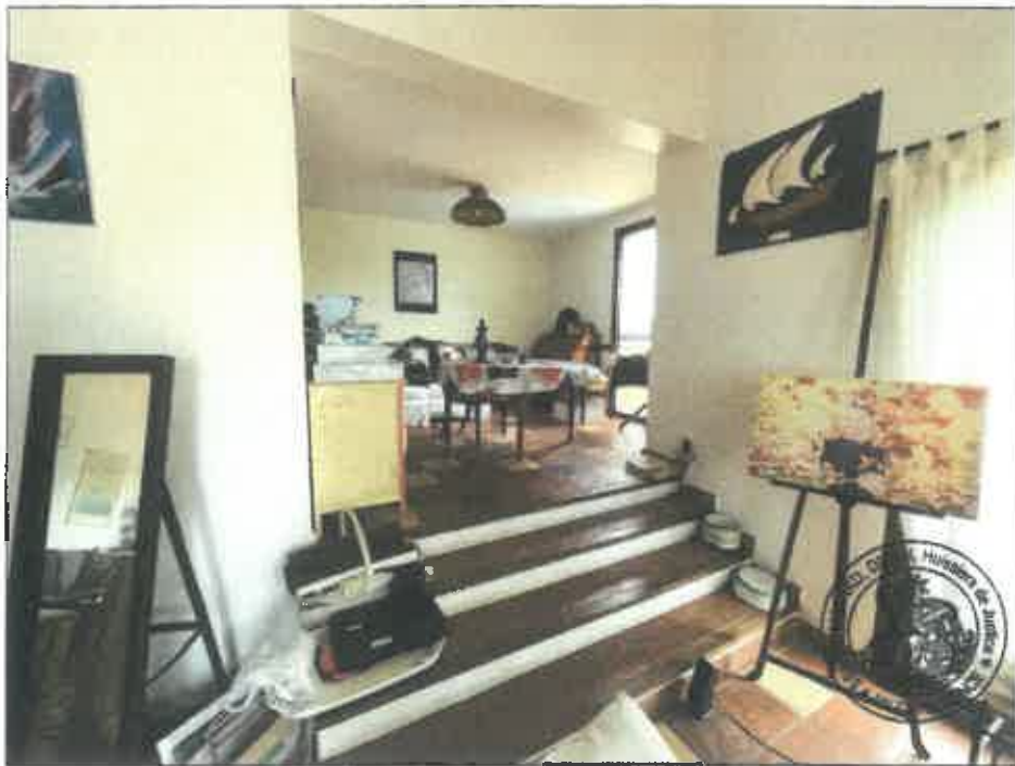
22. (02/06/2023 14:19:31)