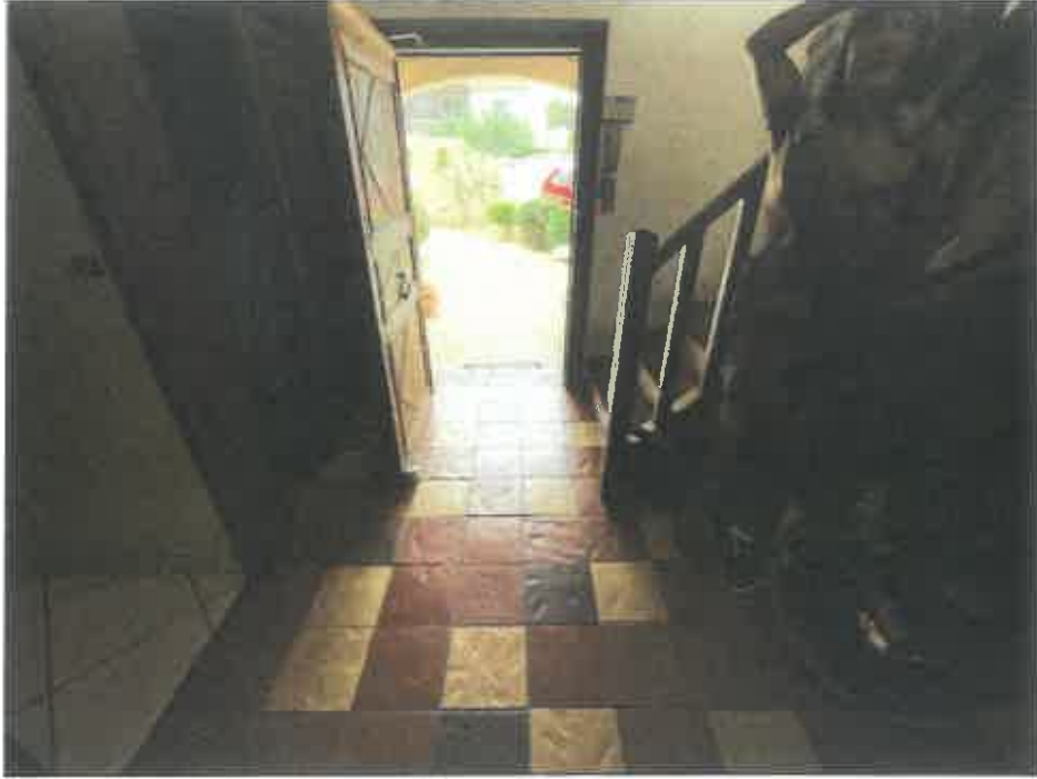
13. (02/06/2023 14:12:02)