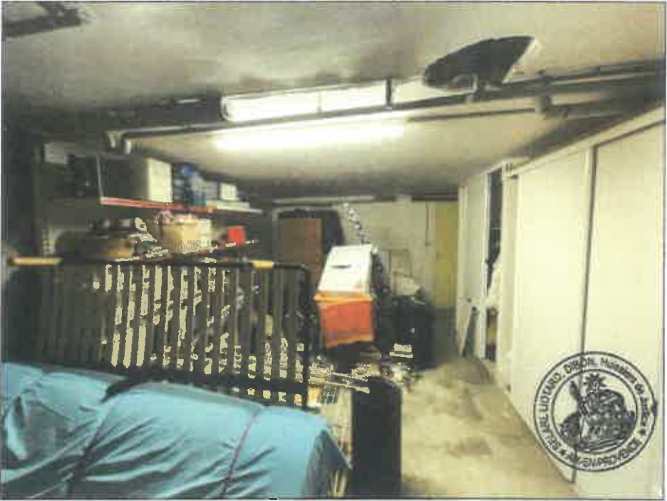
98. (02/06/2023 14:55:14)