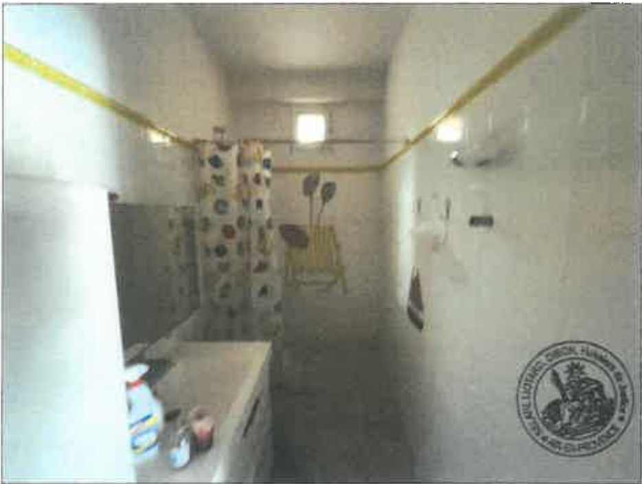
84. (02/06/2023 14:49:04)