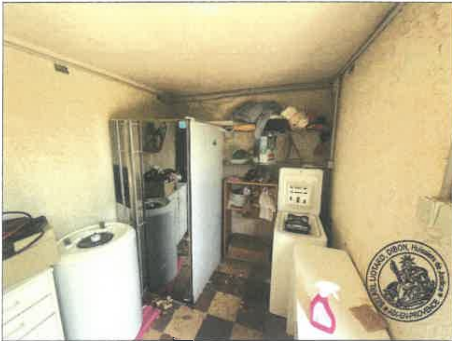
114. (02/06/2023 14:58:58)