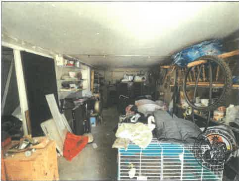
96. (02/06/2023 14:55:02)