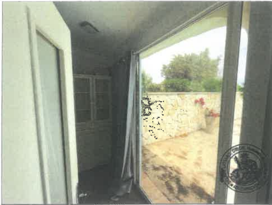
61. (02/06/2023 14:47:04)