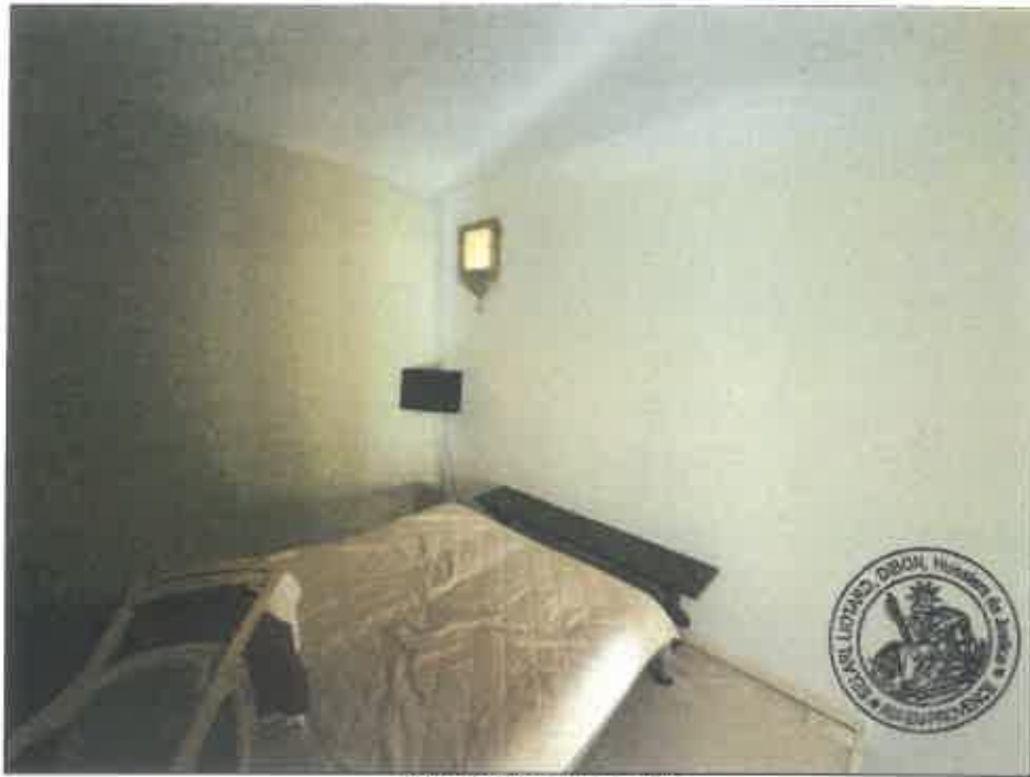
71. (02/06/2023 14:47:47)