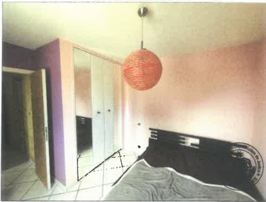
39. (02/06/2023 14:29:47)