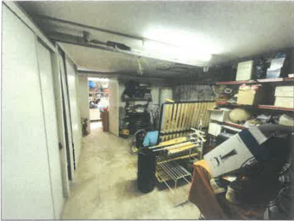
99. (02/06/2023 14:55:20)