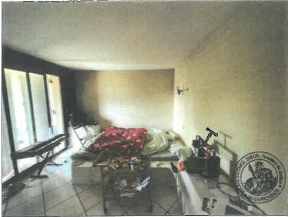
47. (02/06/2023 14:30:20)