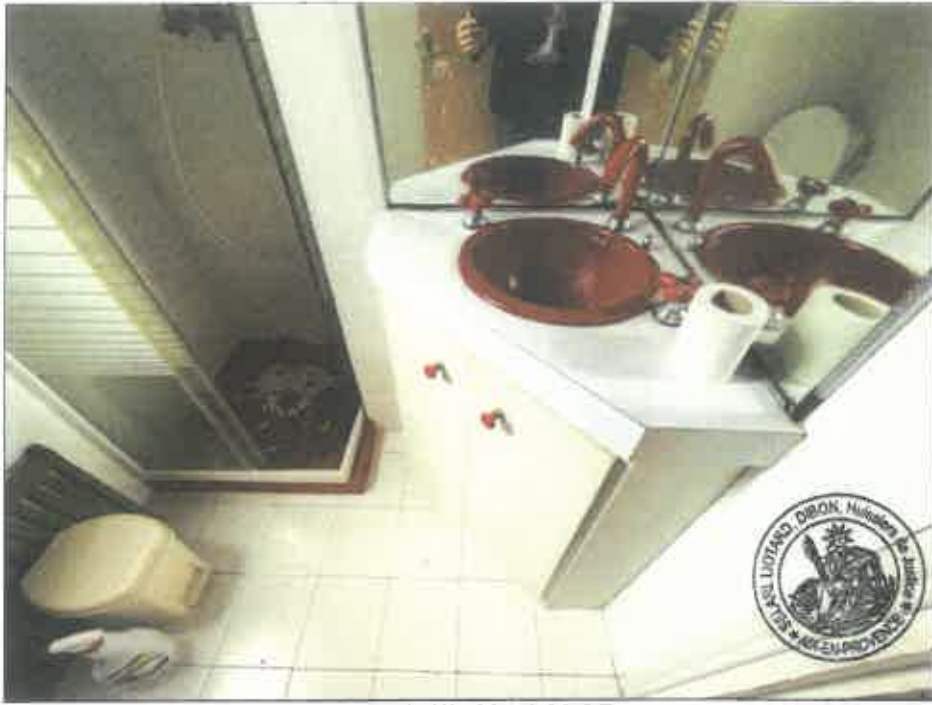
43. (02/06/2023 14:30:05)