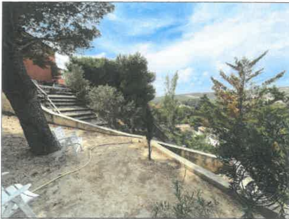
108. (02/06/2023 14:57:46)