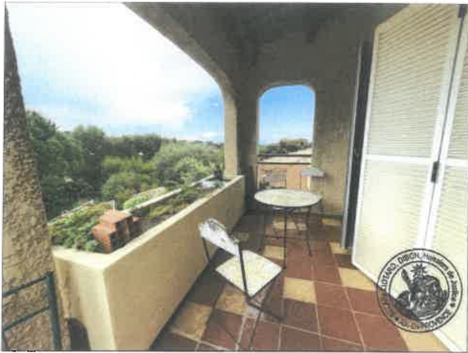
29. (02/06/2023 14:20:45)