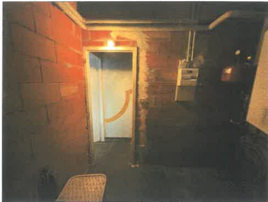
90. (02/06/2023 14:49:56)