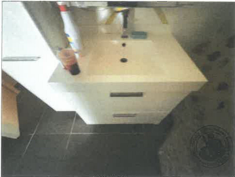
86. (02/06/2023 14:49:09)