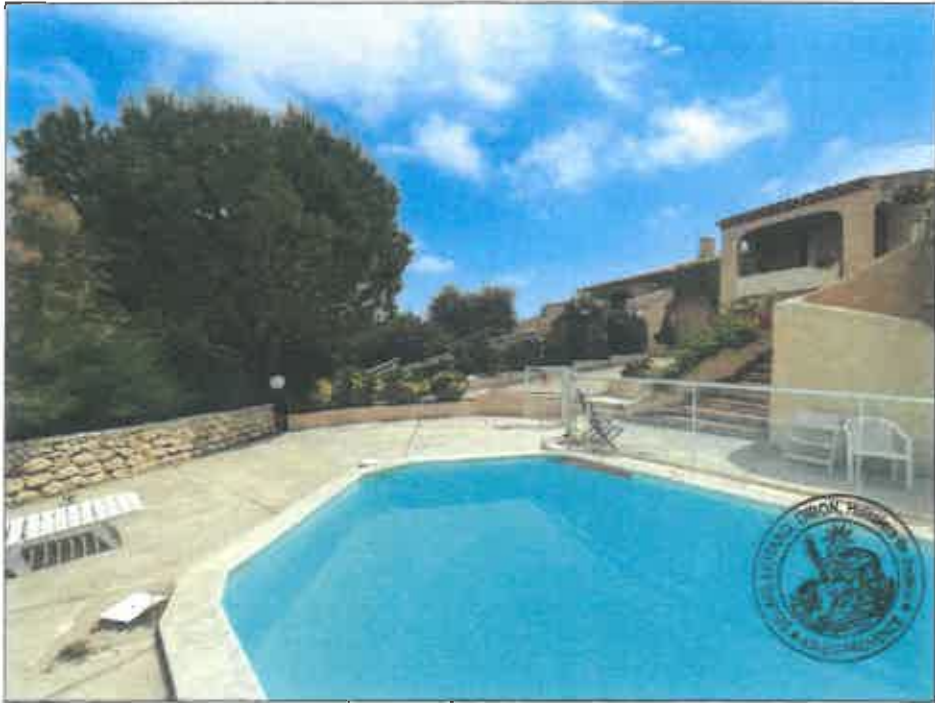
110. (02/06/2023 14:58:26)