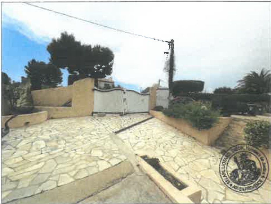
6. (02/06/2023 14:08:23)