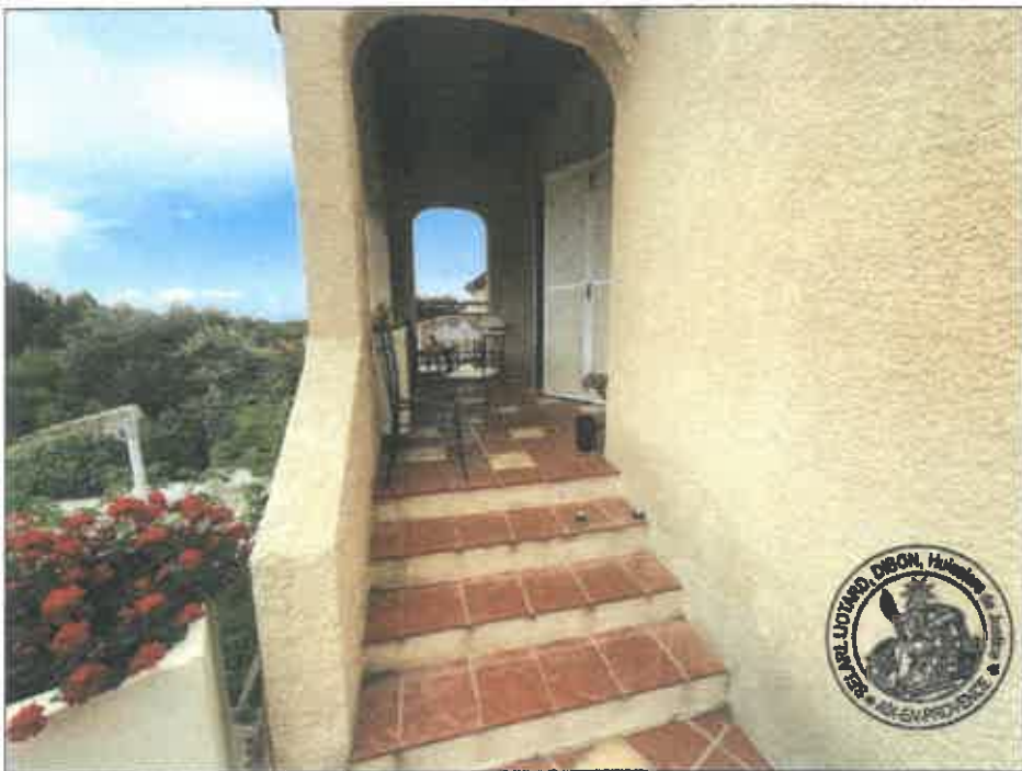
26. (02/06/2023 14:19:56)