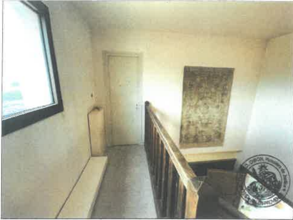
53. (02/06/2023 14:32:03)