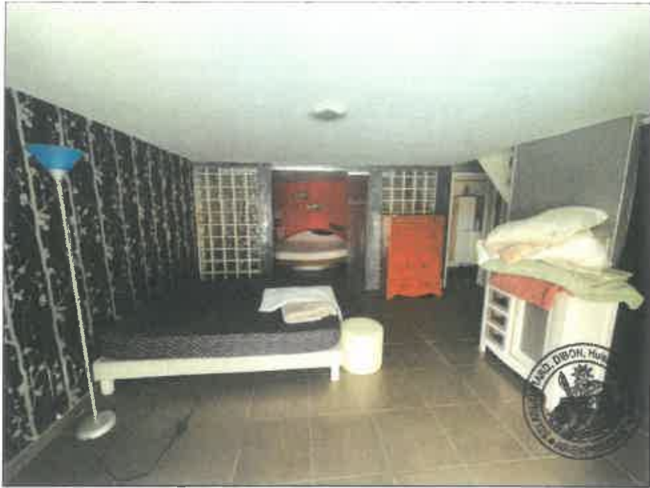
75. (02/06/2023 14:48:13)