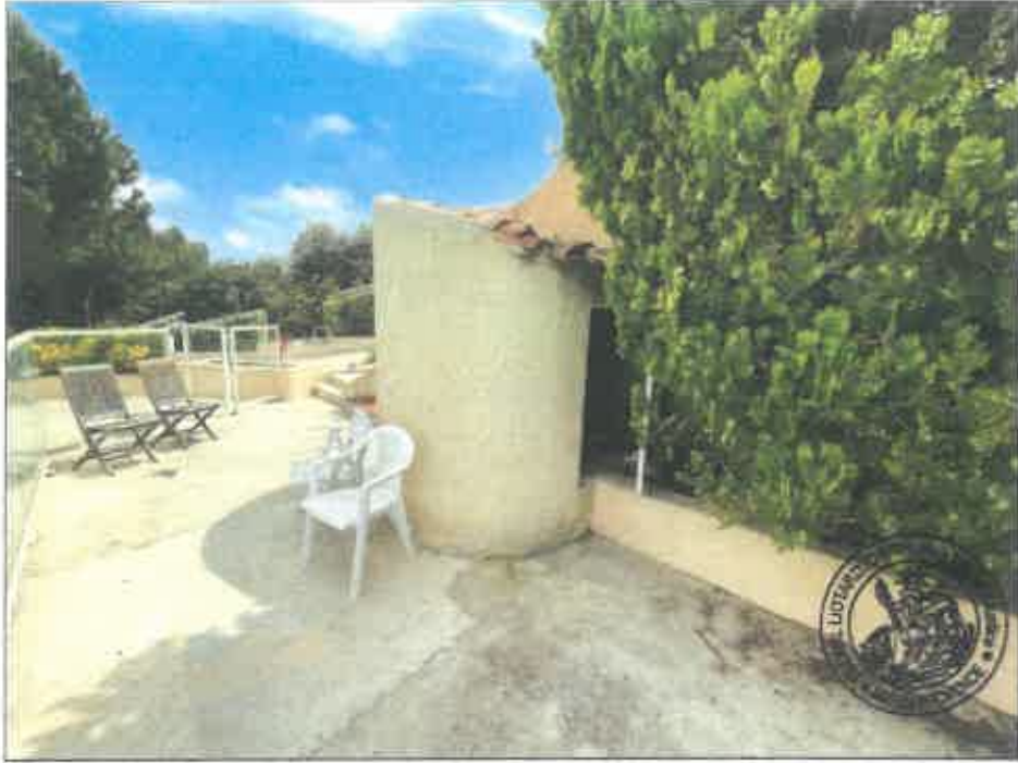
93. (02/06/2023 14:51:24)