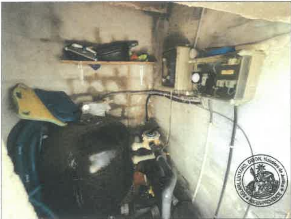
94. (02/06/2023 14:51:38)