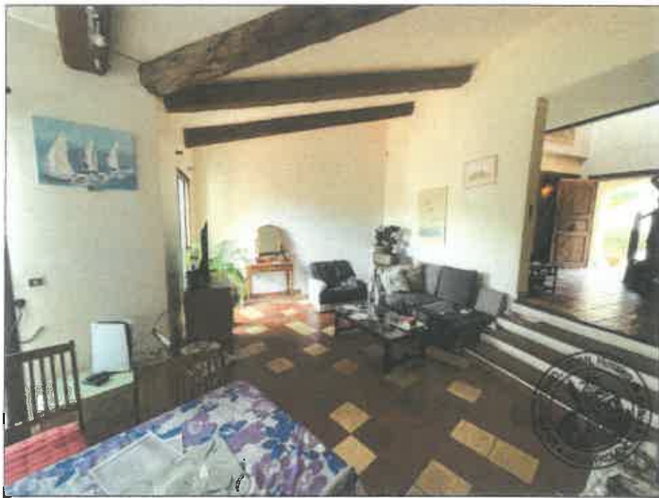
18. (02/06/2023 14:19:08)