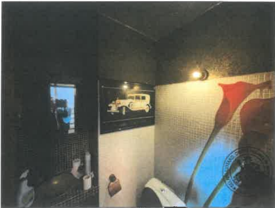
16. (02/06/2023 14:15:45)