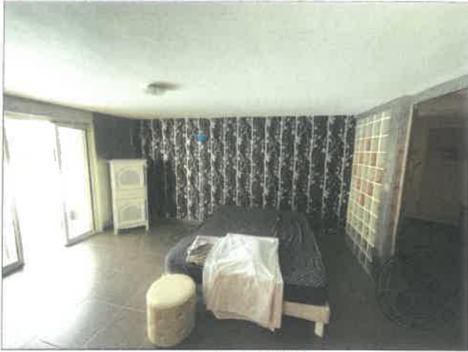
77. (02/06/2023 14:48:22)