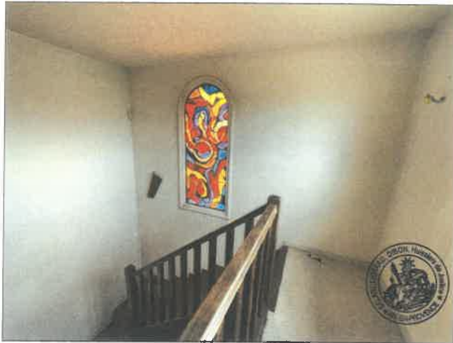
52. (02/06/2023 14:31:59)