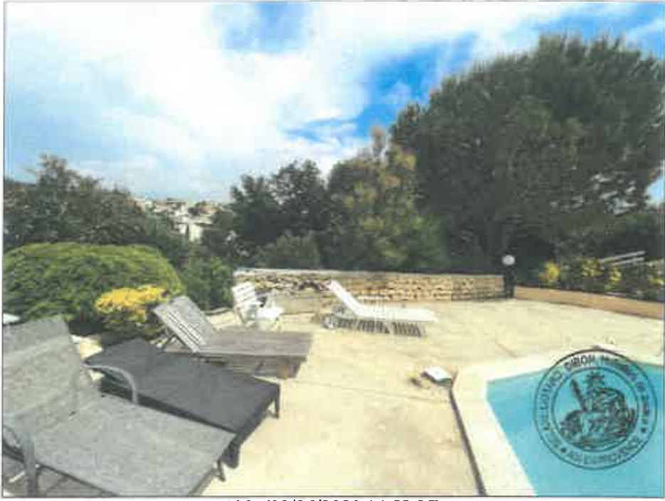
109. (02/06/2023 14:58:25)