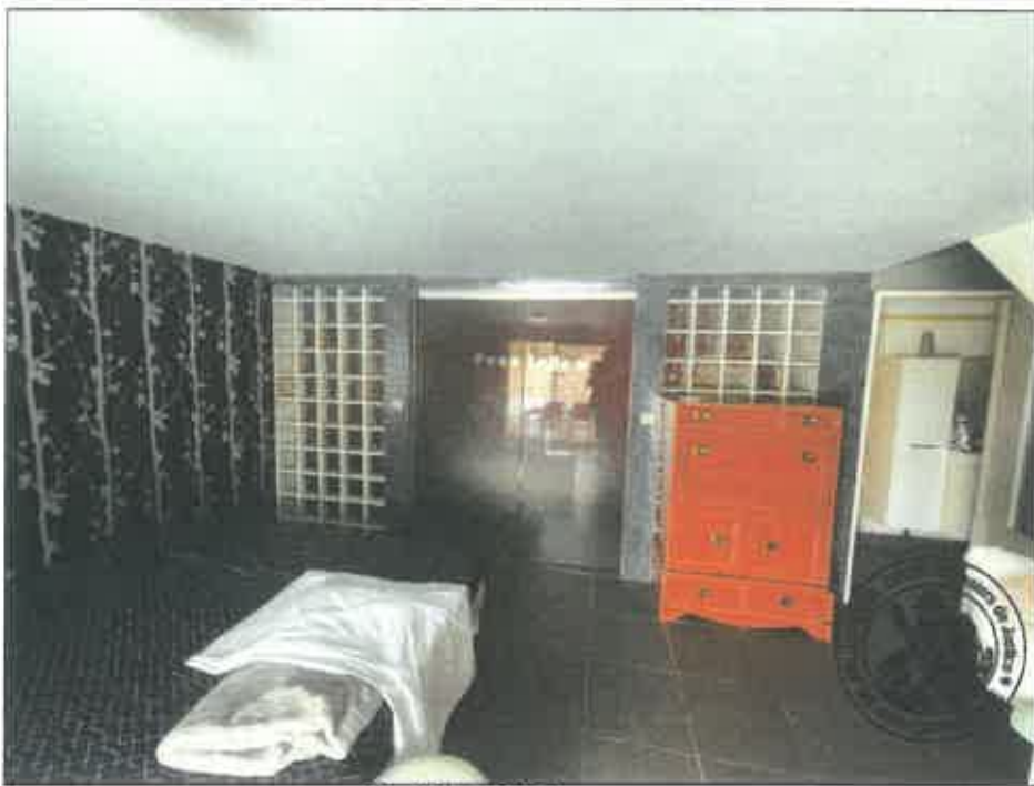
78. (02/06/2023 14:48:34)