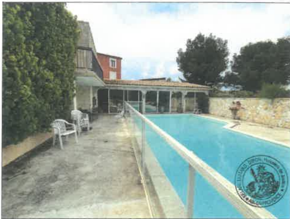
54. (02/06/2023 14:46:26)