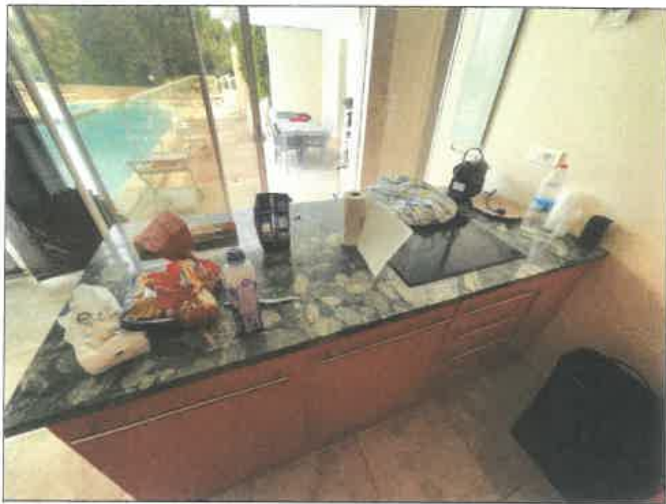
68. (02/06/2023 14:47:34)