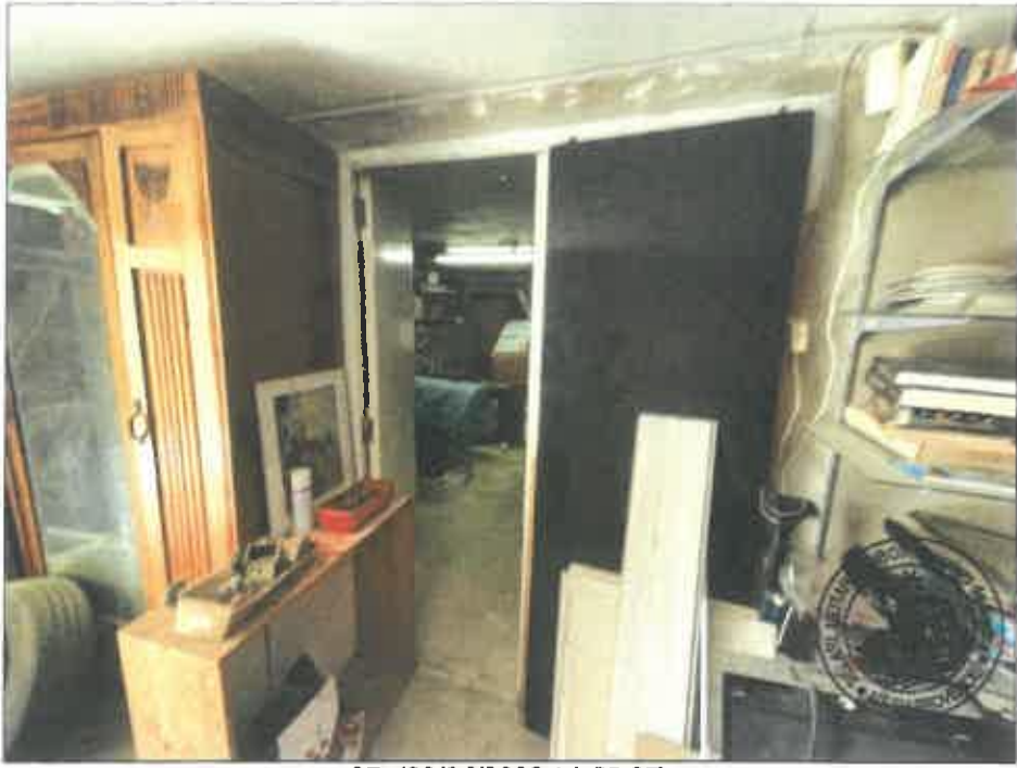
97. (02/06/2023 14:55:07)