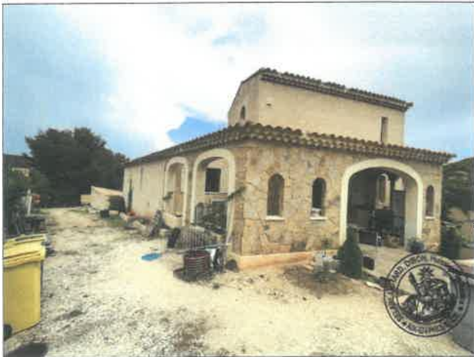
4. (02/06/2023 14:08:06)