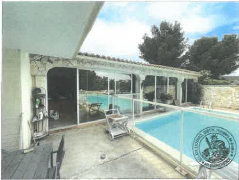
55. (02/06/2023 14:46:35)