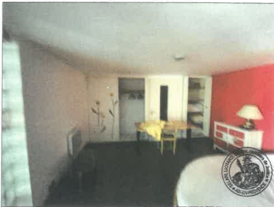
80. (02/06/2023 14:48:44)