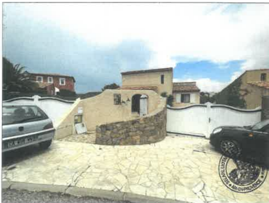
2. (02/06/2023 14:03:51)