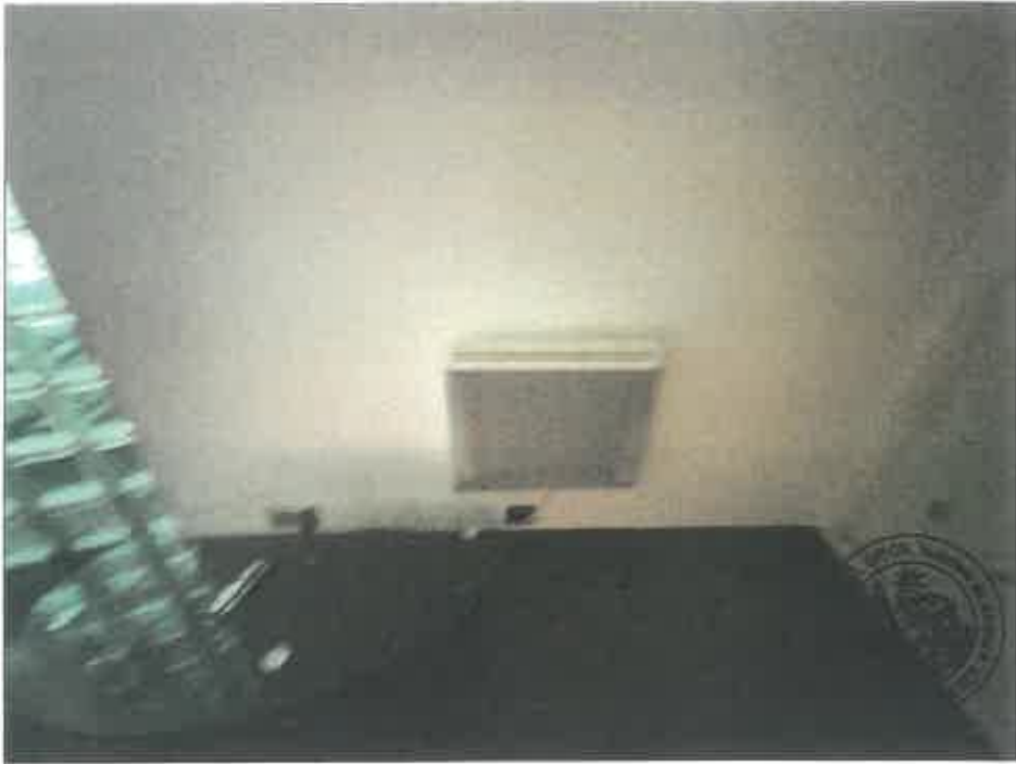
81. (02/06/2023 14:48:48)