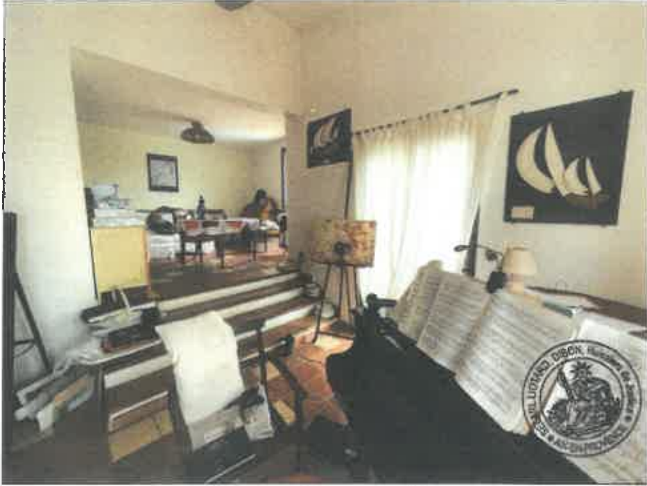
21. (02/06/2023 14:19:28)