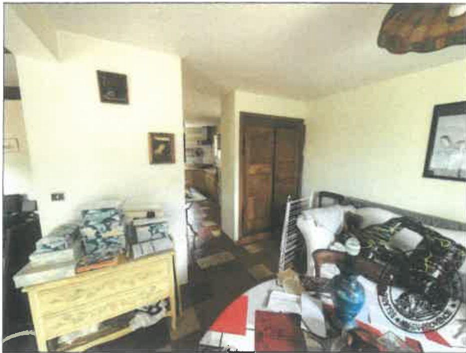
24. (02/06/2023 14:19:40)