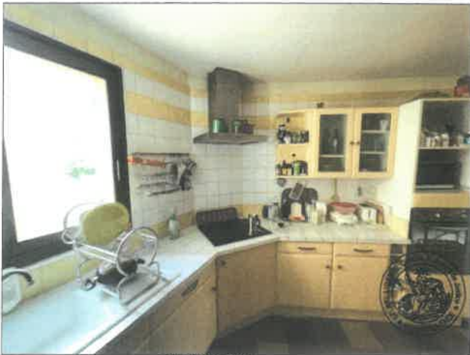
34. (02/06/2023 14:23:21)