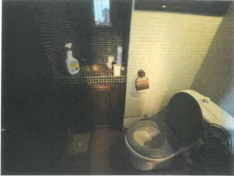
15. (02/06/2023 14:15:42)