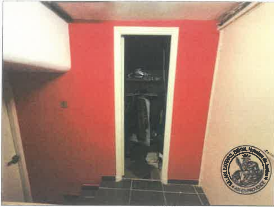
103. (02/06/2023 14:55:45)