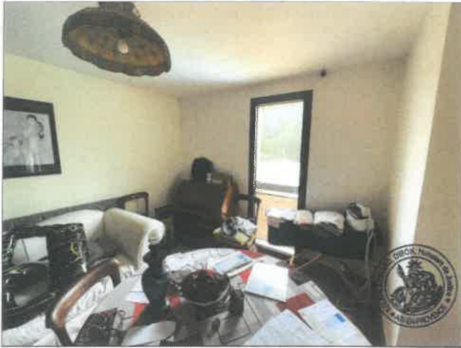
23. (02/06/2023 14:19:37)