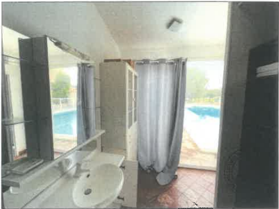
66. (02/06/2023 14:47:17)