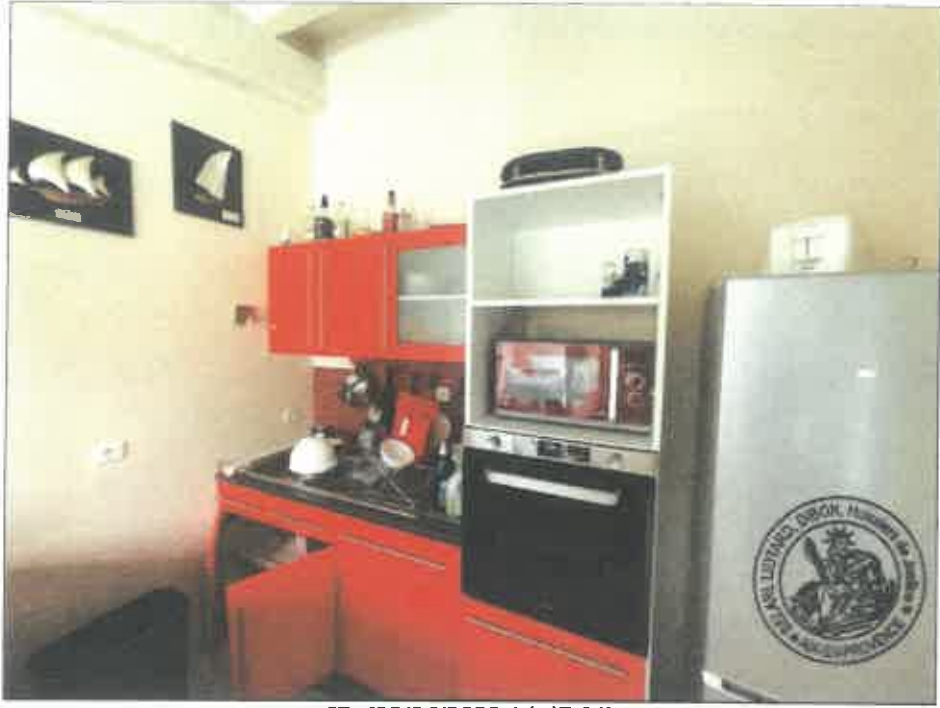
67. (02/06/2023 14:47:31)