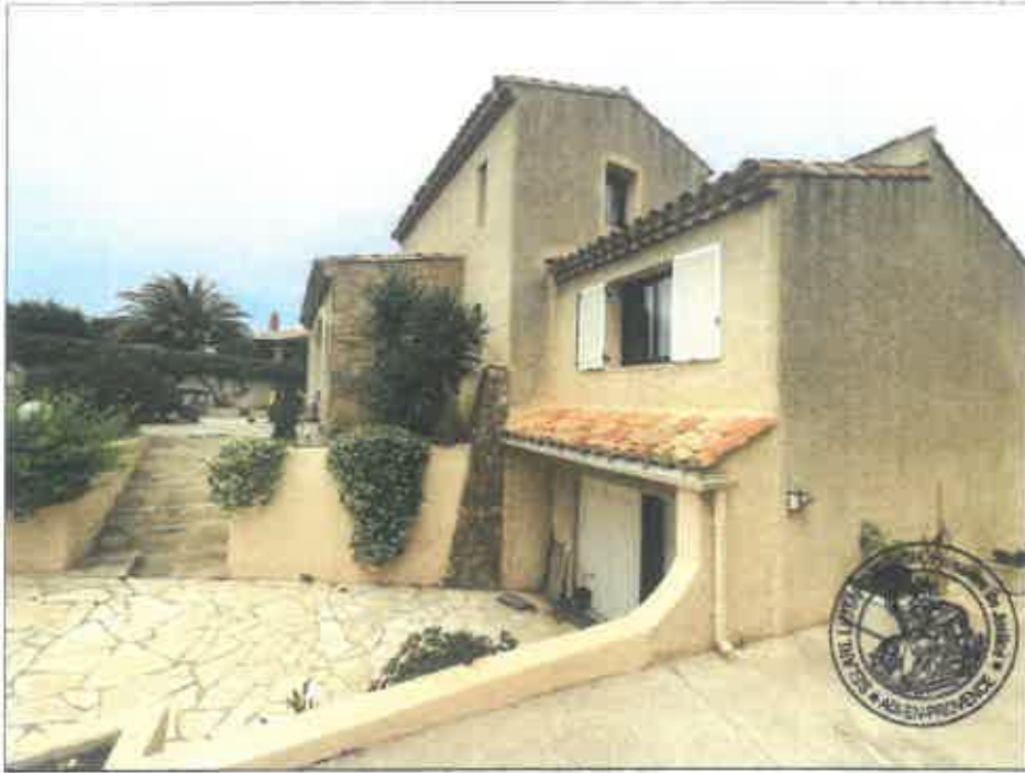
7. (02/06/2023 14:08:26)