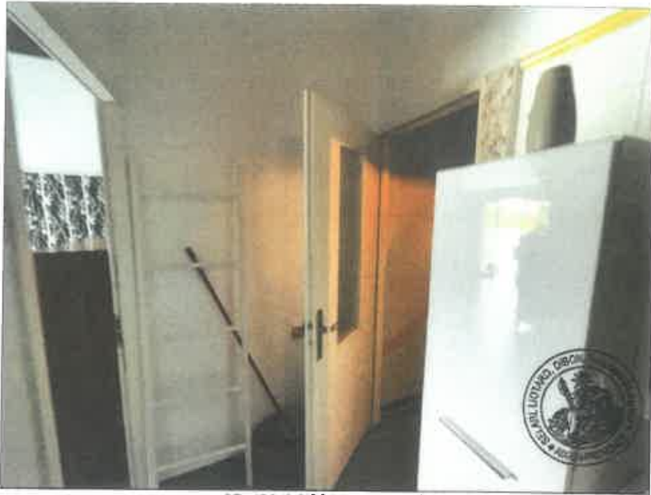
87. (02/06/2023 14:49:11)