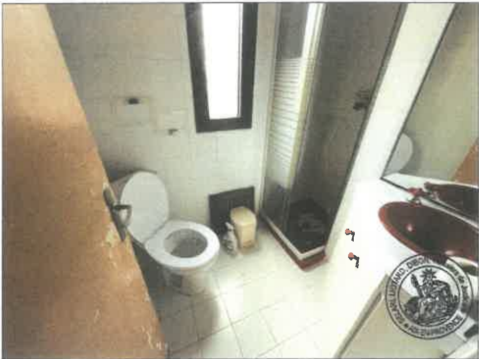
42. (02/06/2023 14:30:02)