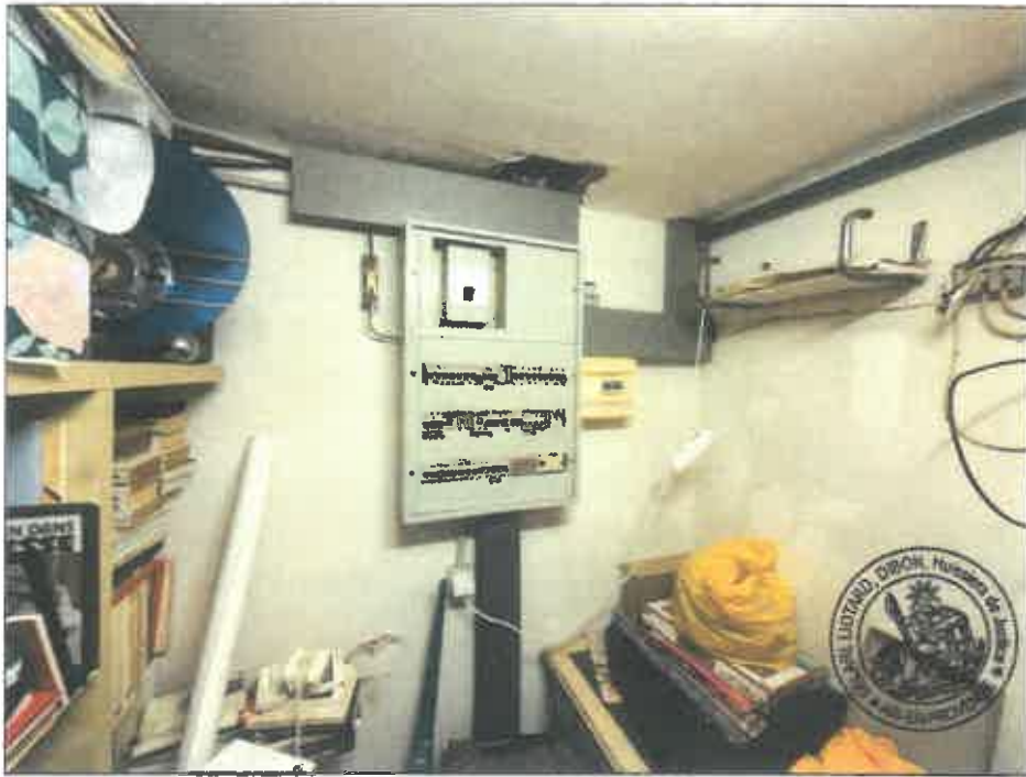
102. (02/06/2023 14:55:38)