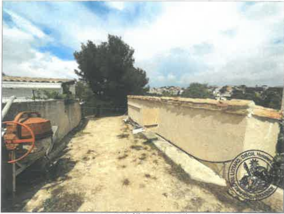
105. (02/06/2023 14:56:50)