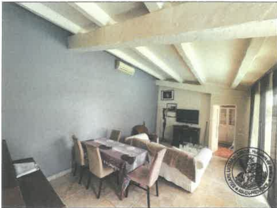
58. (02/06/2023 14:46:48)