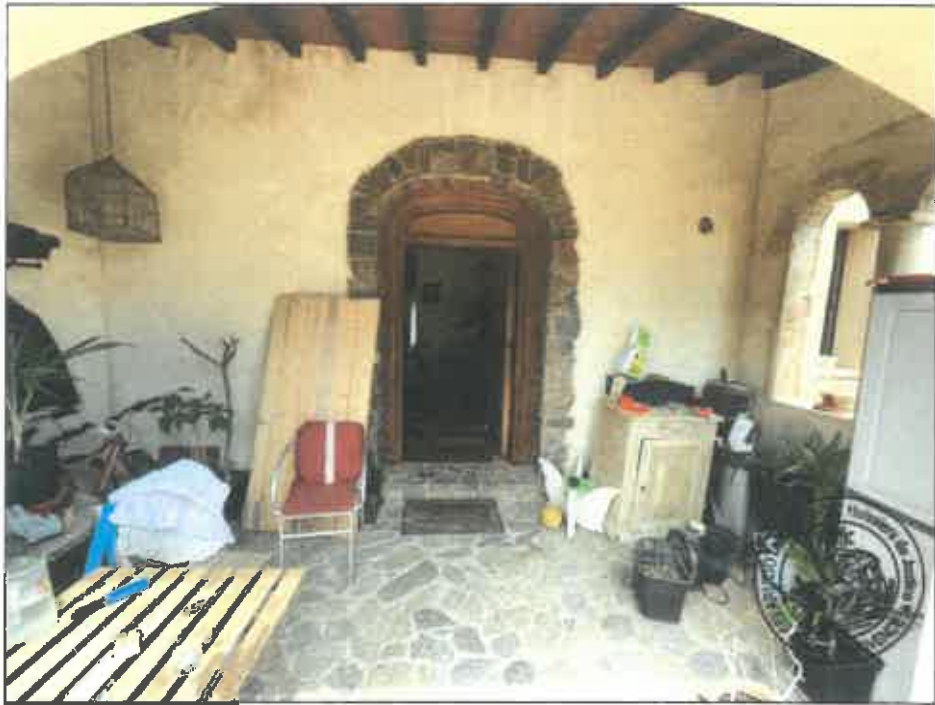
12. (02/06/2023 14:11:50)