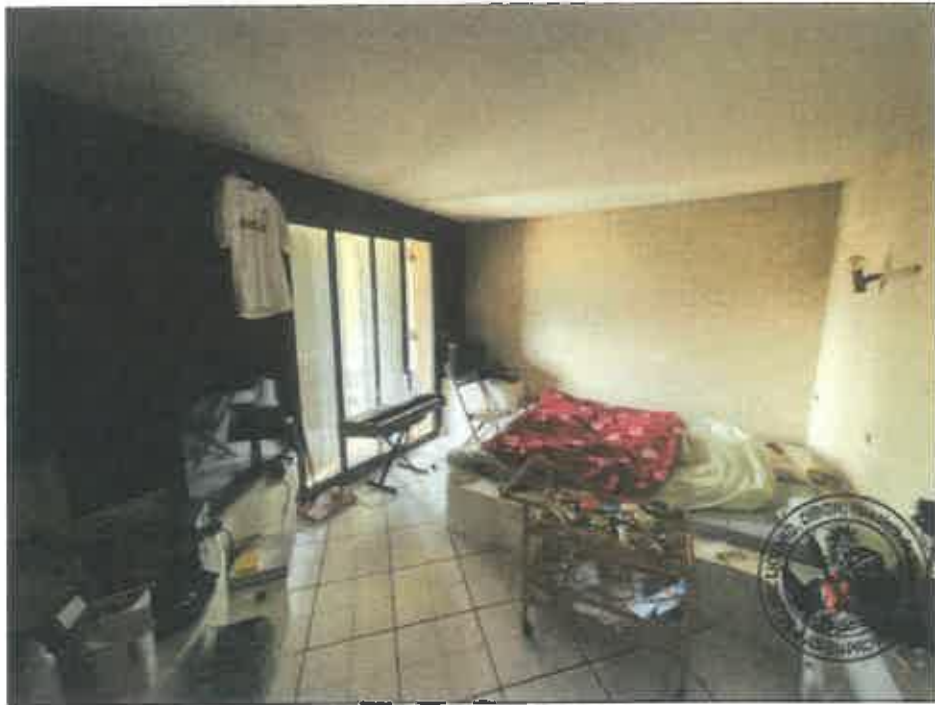
48. (02/06/2023 14:30:21)