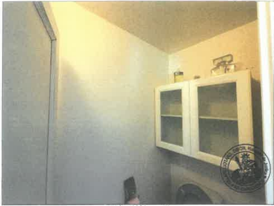
65. (02/06/2023 14:47:15)