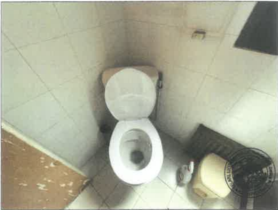
44. (02/06/2023 14:30:08)