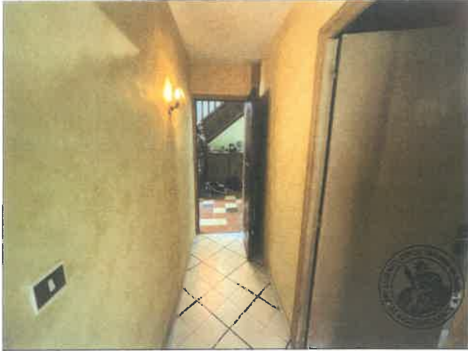
37. (02/06/2023 14:29:37)