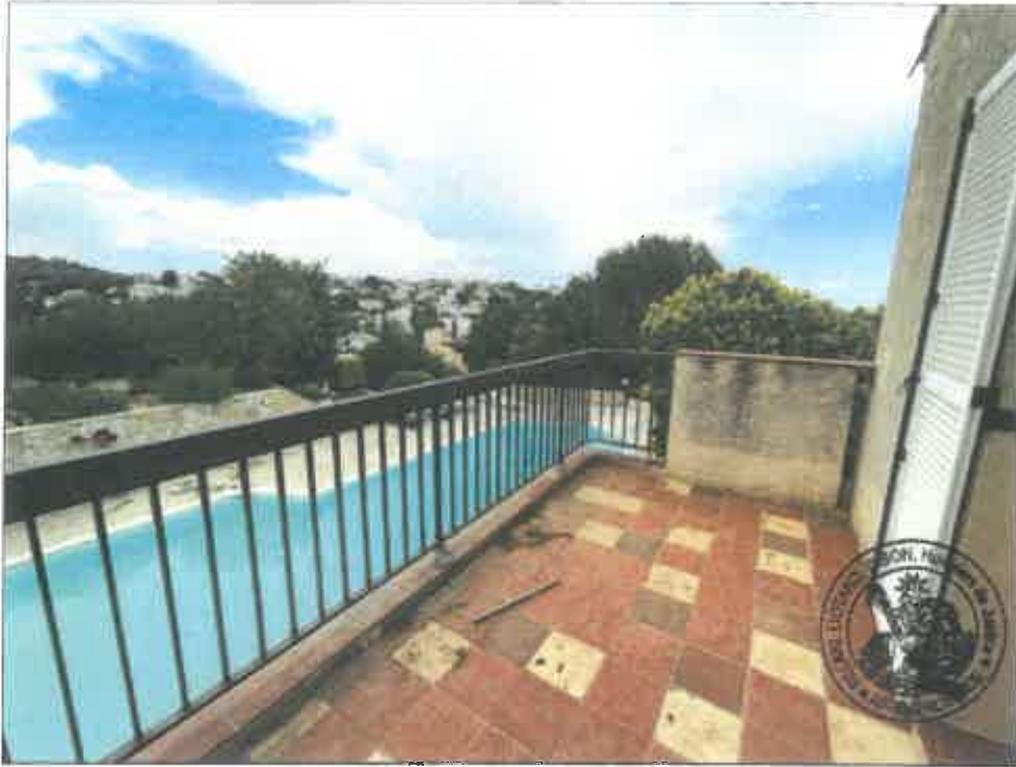
31. (02/06/2023 14:21:41)