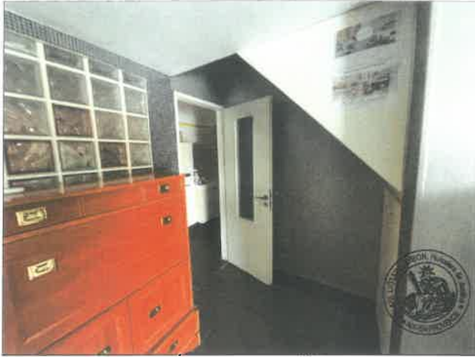
83. (02/06/2023 14:48:59)