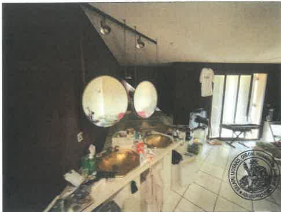
46. (02/06/2023 14:30:17)