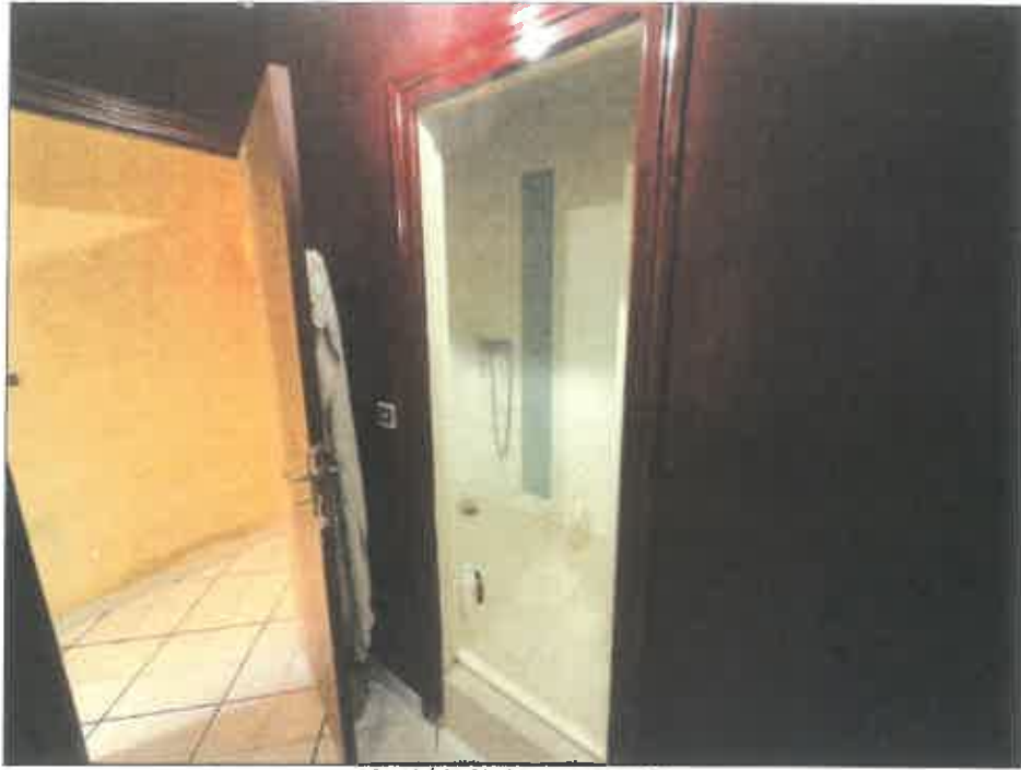
49. (02/06/2023 14:30:48)