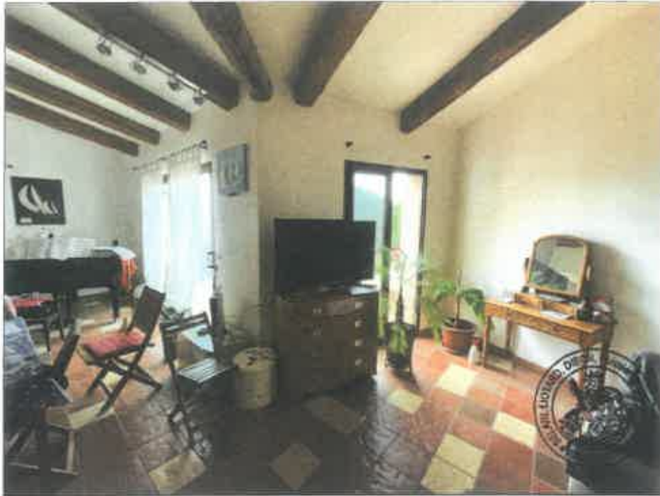
19. (02/06/2023 14:19:14)