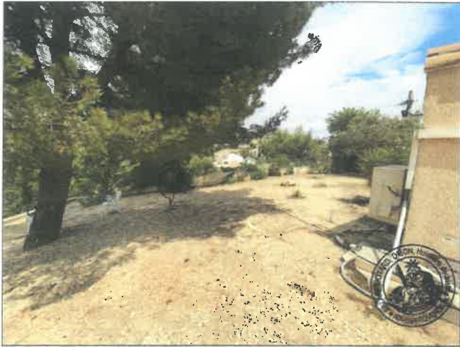
106. (02/06/2023 14:57:03)