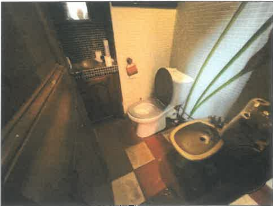
14. (02/06/2023 14:15:39)