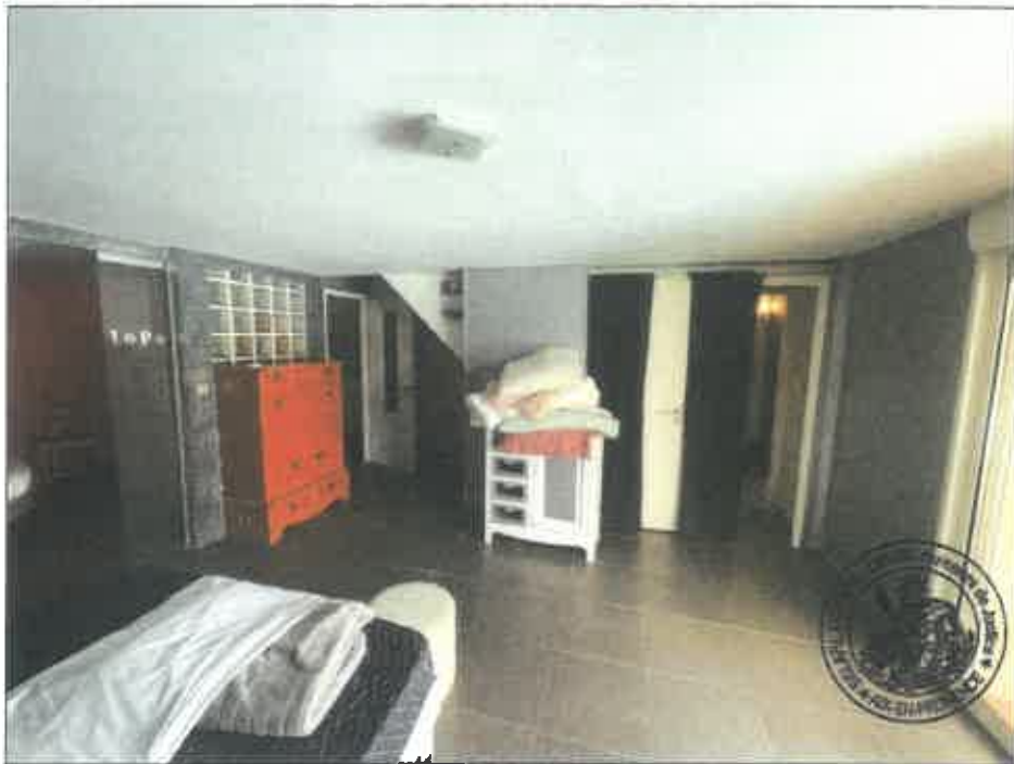
76. (02/06/2023 14:48:17)