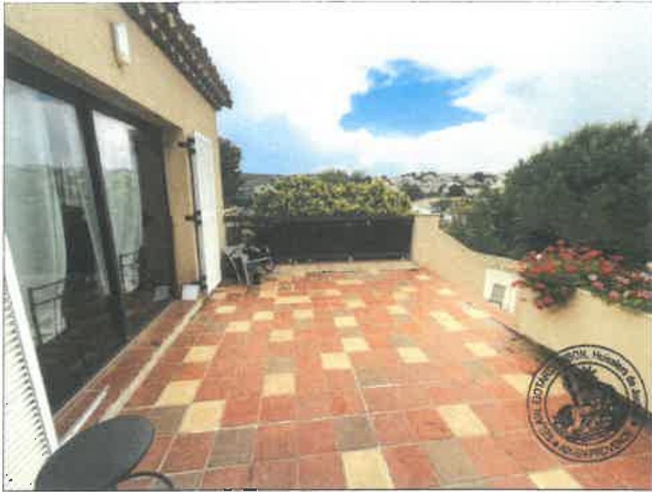
25. (02/06/2023 14:19:52)