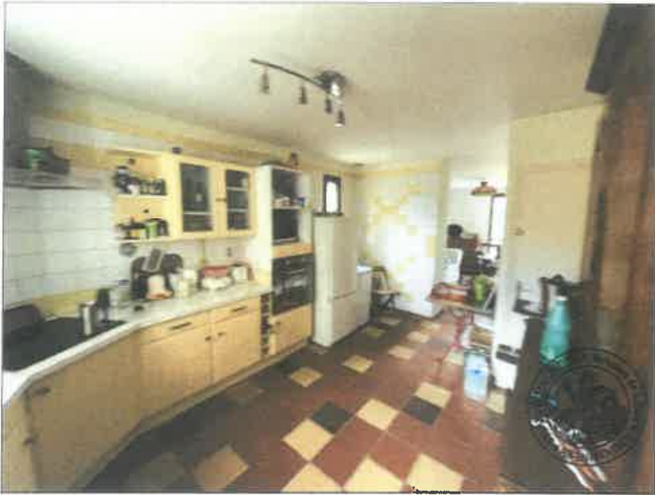
33. (02/06/2023 14:23:19)