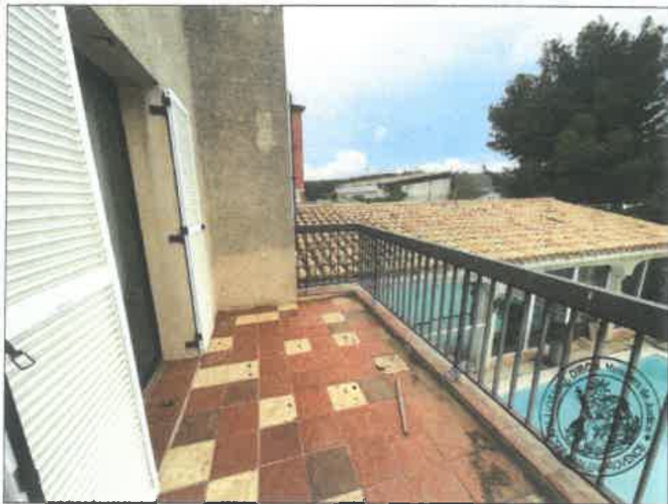
30. (02/06/2023 14:21:36)