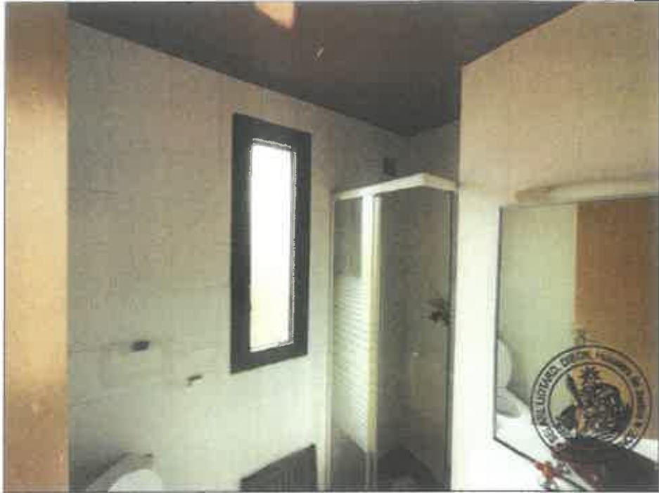
41. (02/06/2023 14:30:00)