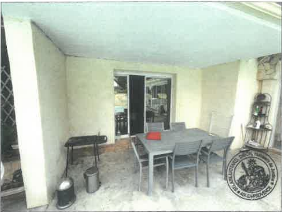
74. (02/06/2023 14:48:09)