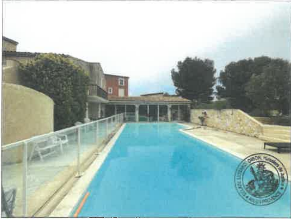
11. (02/06/2023 14:08:57)