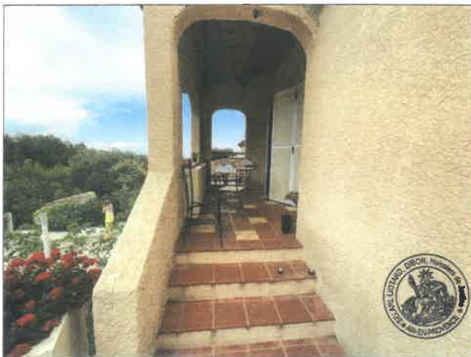
28. (02/06/2023 14:20:41)