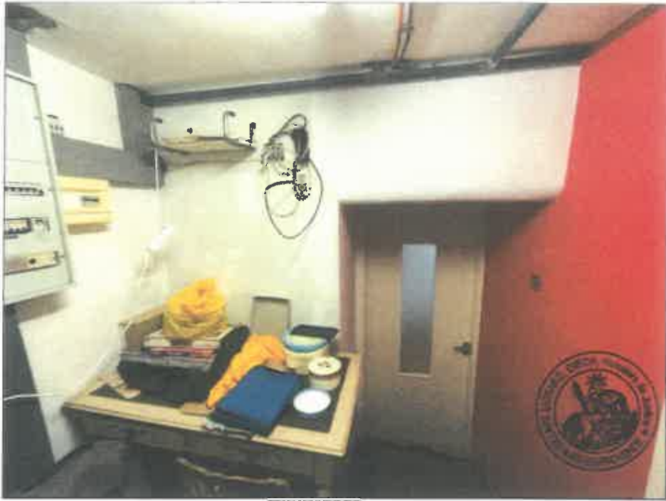
101. (02/06/2023 14:55:35)