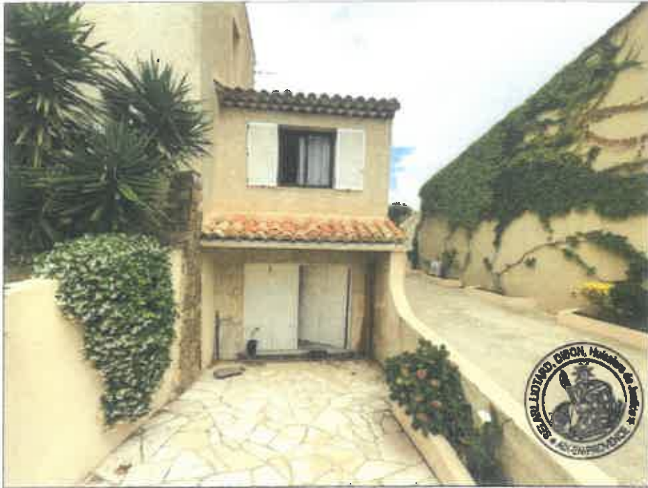
5. (02/06/2023 14:08:18)