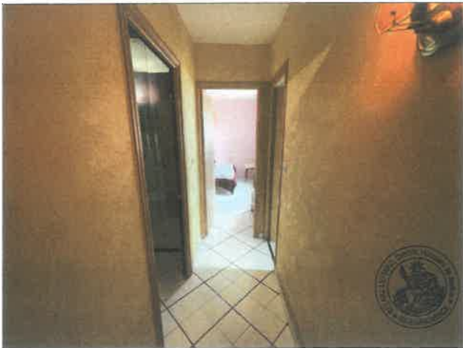
38. (02/06/2023 14:29:40)