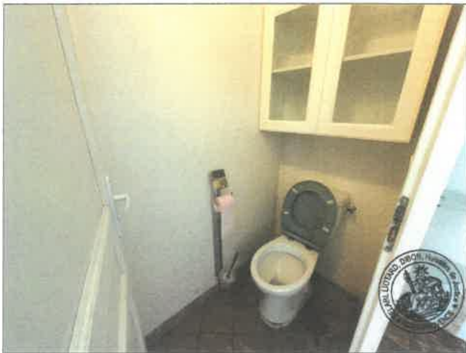
64. (02/06/2023 14:47:13)