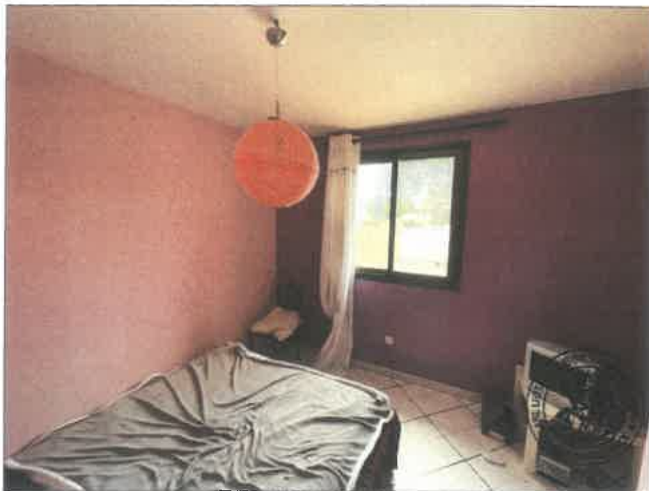
40. (02/06/2023 14:29:52)