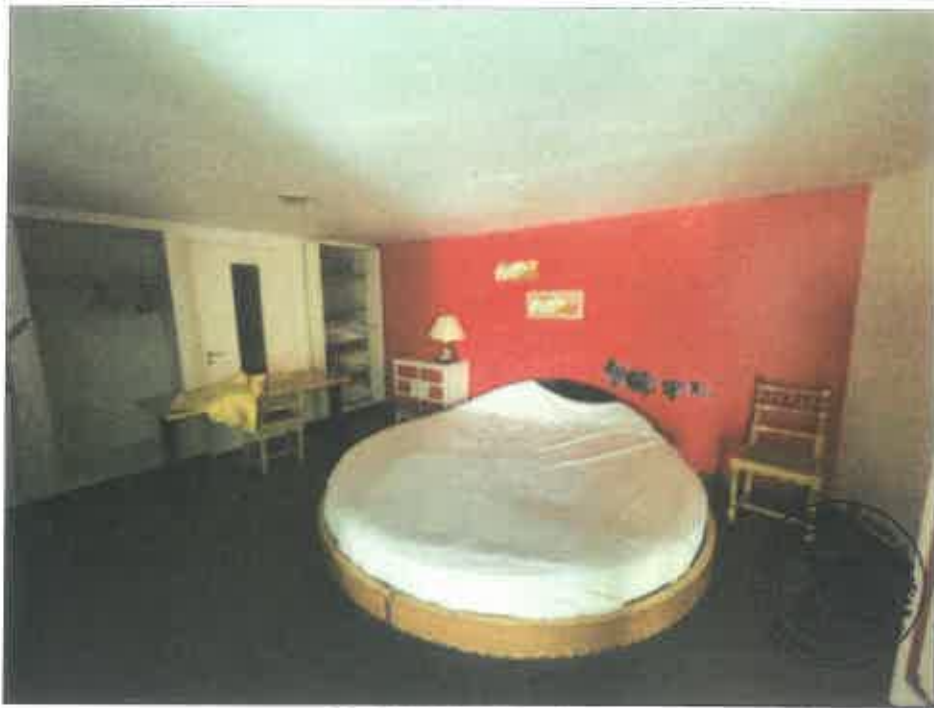
79. (02/06/2023 14:48:42)