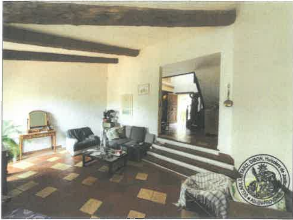
17. (02/06/2023 14:19:07)