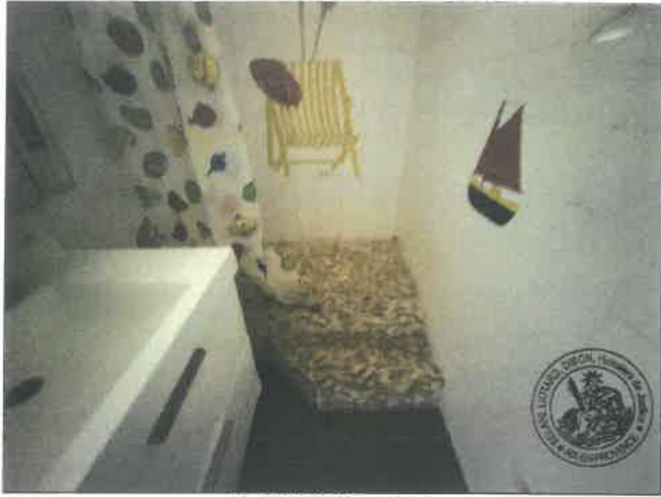
85. (02/06/2023 14:49:06)