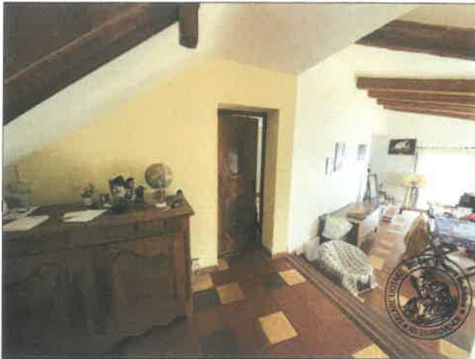
32. (02/06/2023 14:22:17)