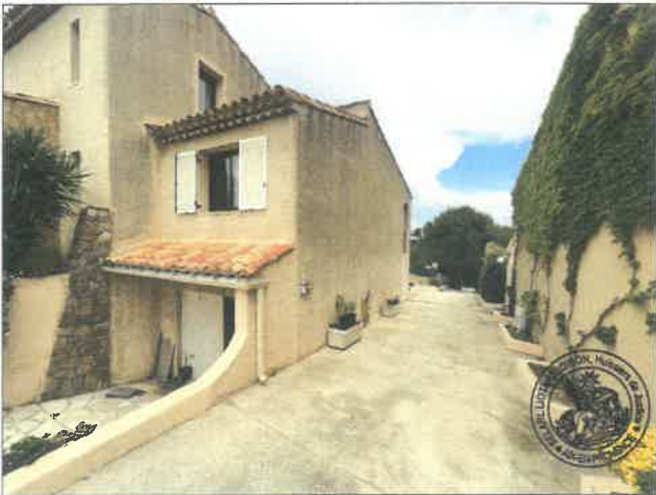
8. (02/06/2023 14:08:27)