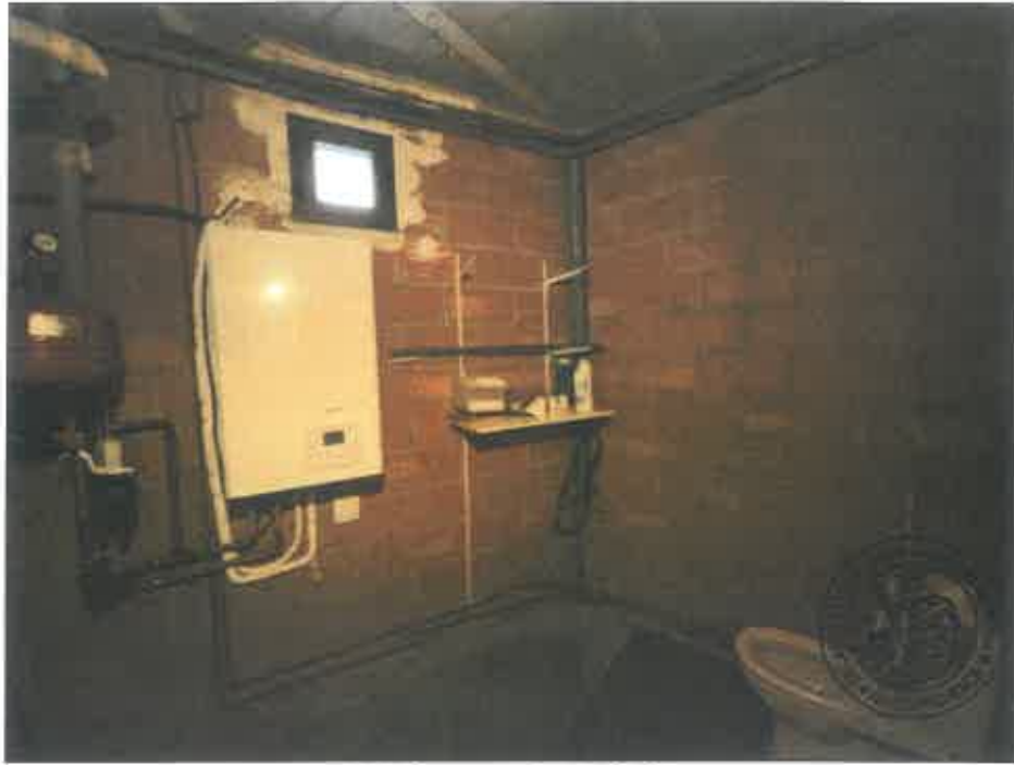
89. (02/06/2023 14:49:18)