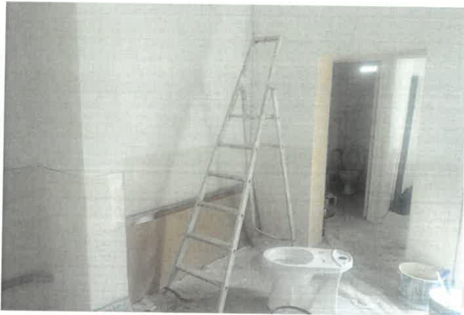
En arrière-boutique un WC et un réduit.